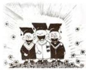
เด็กโรงเรียนสาธิต+มีความพร้อมสูง