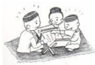
เด็กในพื้นที่ไม่สงบ+สามจังหวัดชายแดนใต้