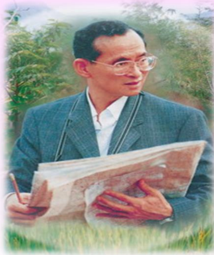
His Majesty King Bhumibol Adulyadej

“ Sufficiency Economy ” is a philosophy conceived and developed since 1974, over 60 years. The King Bhumibol’s speech: “ Sufficient to live and to eat ”. (Por You Por Kin) means to be enough to support ourselves. You should not spend more than you have. (ที่มา: www.thaiembassy.org )