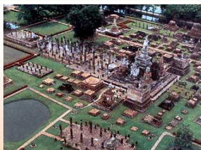
ภาพที่ 1.3 อาณาจักรสุโขทัย

กรุงสุโขทัยตั้งอยู่ในพื้นที่ราบ มีแม่น้ำยมไหลผ่าน จึงสามารถติดต่อกับหัวเมืองอื่นๆ ได้สะดวกทั้งทางบกและทางน้ำ ในแง่ทางยุทธศาสตร์ง่ายต่อการส่งกำลังทหารเข้าป้องกันและต่อสู้กับศัตรู ในแง่เศรษฐกิจก็เป็นชุมทางการค้ามีรายได้จากการค้าขาย ทางด้านการเกษตรก็มีพื้นที่เพาะปลูกสามารถพึ่งตนเองได้ มีแร่ธาตุ สัตว์ป่า ของป่า อุดมสมบูรณ์