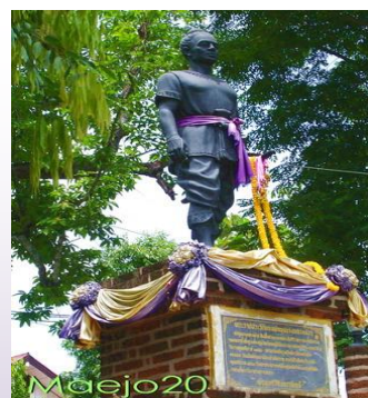
ภาพที่ 1.1 พระบรมราชานุสาวรีย์ พ่อขุนศรีอินทราทิตย์ จังหวัดพิษณุโลก

ภายหลังจากการประกาศให้สุโขทัยเป็นรัฐอิสระพ่อขุนผาเมืองมิได้สืบทอดอำนาจต่อจากพระราชบิดาในสุโขทัย หากแต่ได้อภิเษกพ่อขุนบางกลางหาวขึ้นเป็นกษัตริย์ครองอาณาจักรสุโขทัย พร้อมทั้งพระราชทานพระแสงขรรค์ชัยศรีและราชทินนาม “กมรเตังอัญศรีบดินทราทิตย์” ให้ ดังนั้นพ่อขุนบางกลางหาวจึงนับเป็นปฐมกษัตริย์แห่งราชวงศ์พระร่วง ซึ่งปรากฏพระนามในจารึกพ่อขุนรามคำแหงมหาราช ว่า “พ่อขุนศรีอินทราทิตย์”