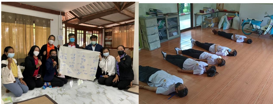
ภาพการดำเนินงานการจัดกิจกรรมจิตศึกษา