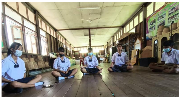
ภาพนักเรียนชั้น มัธยมศึกษาปีที่ ๓ ทำแผนการดำเนินงานโครงการคุณธรรมประจำห้องเรียน “จิตศึกษา พัฒนาปัญญาภายใน”