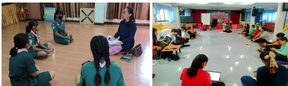
ภาพกิจกรรมแลกเปลี่ยน ซึ่นชมความดีผ่านกิจกรรม จิตศึกษา กิจกรรมจัดกายจัดใจ และ PLC