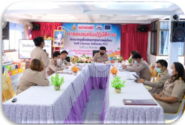
ภาพการวางแผนการดำเนินงานกิจกรรม “จิตศึกษา พัฒนาปัญญาภายใน” ในโรงเรียนบ้านหนองแสน