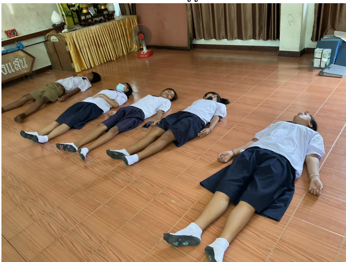
ภาพนักเรียนชั้น มัธยมศึกษาปีที่ ๓ ทำแผนการดำเนินงานโครงการคุณธรรมประจำห้องเรียน กิจกรรม Body Scan