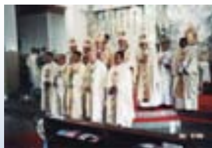
ภาพที่ 7.9 ศีลบวชหรือนุกรม