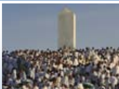
ภาพที่ 7.5 การประกอบพิธีฮัจญ์

เป็นการบริจาคทานครบรอบหนึ่งปี ของชาวมุสลิมผู้มีทรัพย์สิน