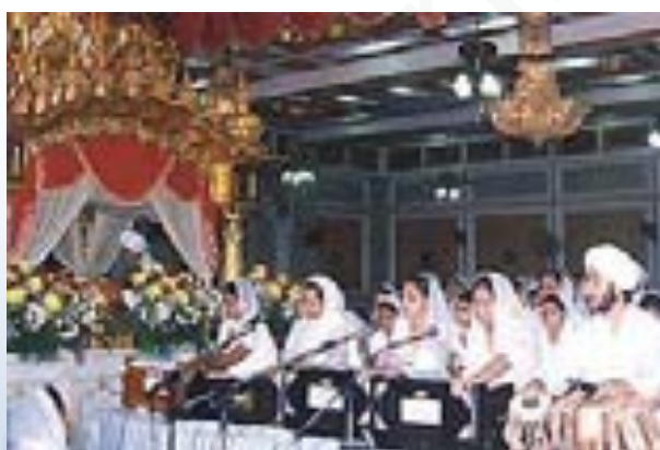
ภาพที่ 7.15 พิธีสวดภาวนา