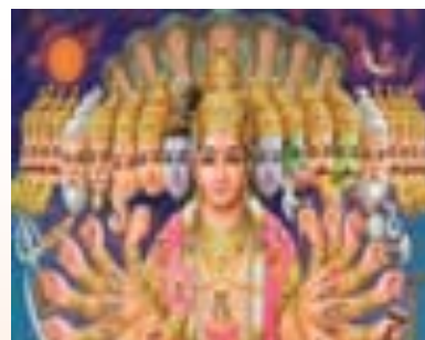
ภาพที่ 7.10 พระนารายณ์