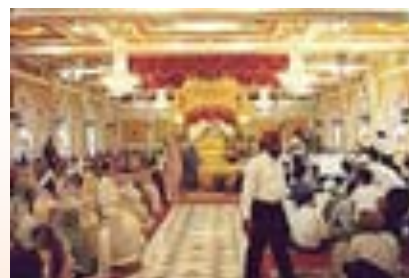
ภาพที่ 7.14 พิธีสังคัต

2) พิธีสังคัต เป็นพิธีชุมนุมของศาสนิกชน ผู้เข้าร่วมพิธีต้องเช็ดรองเท้า ตักน้ำ ทำทุกอย่างด้วยตนเอง ไม่มีผู้ใดได้รับการยกเว้น โดยเชื่อกันว่าหากผู้ใดปฏิบัติตามได้มาก ยิ่งเป็นศาสนิกชนของศาสนาสิกข์ที่ดีมากขึ้น