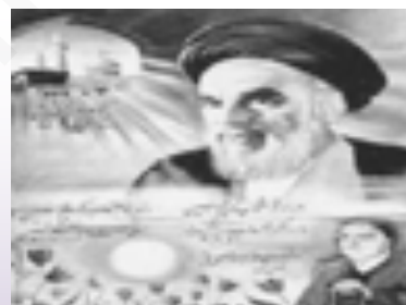
ภาพที่ 7.1 อัลลอห์

6) ศรัทธาในกฎสถานะของพระอัลลอห์ มุสลิมต้องเชื่อว่าพระอัลลอห์เป็นผู้ลิขิตชีวิตมนุษย์ เหตุการณ์ที่เกิดขึ้นไปตามลิขิตของอัลเลาะห์