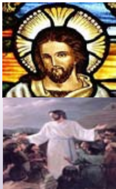
ภาพที่ 7.6 พระเยซูคริสต์