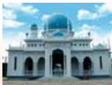
ภาพที่ 7.2 มัสยิด