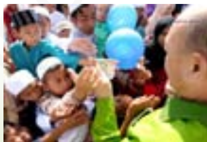
ภาพที่ 7.4 การบริจาคซะกาต