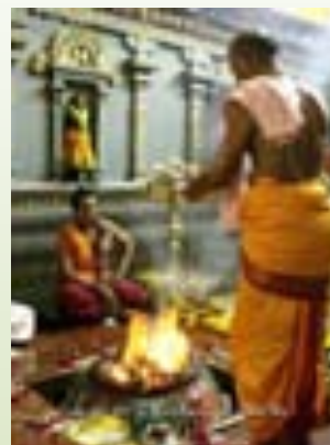
ภาพที่ 7.12 พิธีบูชาเทพ