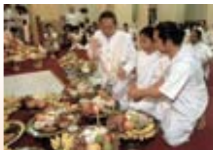
ภาพที่ 7.11 พิธีแต่งงาน

4. พิธีบูชาเทพเจ้า ซึ่งในแต่ละวรรณะจะมีการ ปฏิบัติต่างกัน