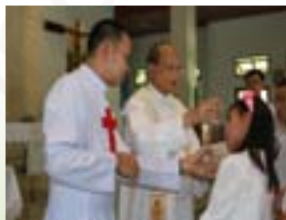
ภาพที่ 7.8 ศีลล้างบาป ผู้ที่เข้ามานับถือศาสนาคริสต์