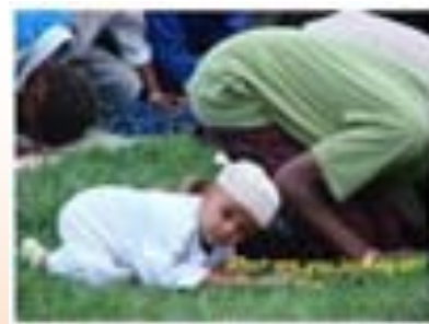
ภาพที่ 7.3 การละหมาด

5) การประกอบพิธีฮัจญ์ หรือการไปแสวงบุญ เป็นการออกเดินทางไปปฏิบัติศาสนกิจที่เมืองเมกกะ ประเทศซาอุดีอาระเบีย มีจุดมุ่งหมายเพื่อให้มุสลิมระลึกถึงพระเจ้า และได้พบปะพี่น้องมุสลิมจากทั่วโลก พิธีนี้จะกระทำในเดือน 12 ของปฏิทินศาสนาอิสลาม ผู้ที่เข้าร่วมพิธีทุกคนต้องแต่งกายด้วยชุดสีขาว ซึ่งผู้เดินทางมาร่วมประกอบพิธีกรรมดังกล่าวเป็นชาวมุสลิมที่มาจากประเทศต่างๆ ทั่วโลก