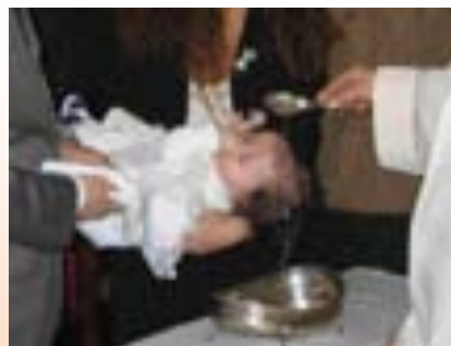
ภาพที่ 7.7 ศีลล้างบาปทารกที่เกิดใหม่

นอกจากนี้ยังมีพิธีมิสซา ซึ่งเป็นการเข้าไปร่วม สวดมนต์ที่โบสถ์ทุกๆ วันอาทิตย์ ซึ่งมักกระทำ ร่วมกับกันพิธีรับศีลมหาสนิท