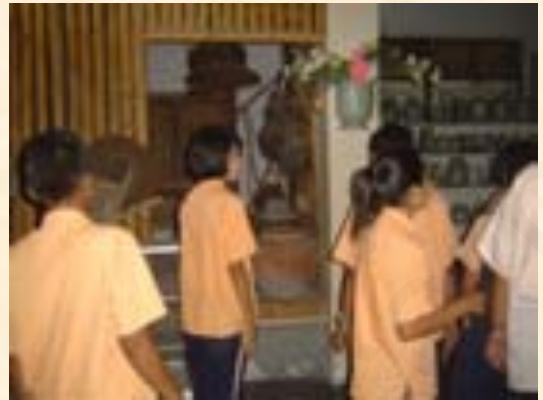
พิพิธภัณฑ์พื้นบ้านพระแท่นดงรัง วัดพระแท่นดงรัง อ.ท่ามะกา จ.กาญจนบุรี

พิพิธภัณฑ์พื้นบ้านพระแท่นดงรัง เป็นพิพิธภัณฑ์ที่รวบรวมเครื่องใช้สิ่งของของชาวบ้านที่ใช้กันอยู่ในชีวิตประจำวัน เช่นเครื่องใช้ภายในครัวเรือน เช่น โต๊ะเครื่องแป้ง ตู้ใส่เสื้อผ้า ตะกร้า โอ่ง ไห ถ้วย ชาม เครื่องมือจับสัตว์น้ำ เช่น ลอบ ไซ แห อวน เบ็ดตกปลา เครื่องมือจับปลาไหล เครื่องมือจับสัตว์เช่น แย้ นกคุ้ม เครื่องมือหาหินทางด้านเกษตรกรรม ซึ่งวัตถุที่แสดงอยู่ในพิพิธภัณฑ์พื้นบ้านพระแท่นดงรัง ได้บอกประวัติความเป็นมาวิถีการดำเนินชีวิตของชาวบ้าน ว่ามีการเป็นอยู่อย่างไรและยังส่งผลต่อวัฒนธรรม ประเพณีในด้านต่างๆที่สืบทอดกันมาจนถึงปัจจุบัน