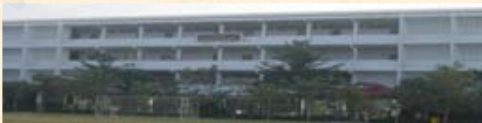
อาคารเรียนโรงเรียนพระแท่นดงรังวิทยาการ อ.ท่ามะกา จ. กาญจนบุรี

โรงเรียนพระแท่นดงรังวิทยาการ เป็นแหล่งเรียนรู้ที่อยู่ในโรงเรียน ตั้งอยู่ในแหล่งชุมชนที่มีอาชีพส่วนใหญ่เป็นเกษตรกรรม ปลูกพืชเศรษฐกิจเช่นอ้อย ทำนาข้าว และพืชไร่