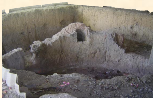
เตาเผาโบราณบ้านหมอสอ ต.พระแท่น อ.ท่ามะกา จ.กาญจนบุรี

โบราณสถานที่สำคัญของตำบลพระแท่นอีกแห่งหนึ่งคือ เตาเผาโบราณบ้านหมอสอ ซึ่งกรมศิลปากรได้มาสืบค้น และได้สรุปความเห็นว่าเป็นเตาเผาโบราณนี้มีอายุราว 200-300 ปี เตาเผาไม่ใช่เตาเผาภาชนะวัตถุดินเผาแต่เป็นเตาเผาปูนขาว เมื่อเผาเสร็จแล้วก็ล่องเรือส่งไปตามลำคลองเตาเผาโบราณแห่งนี้ ตั้งอยู่ในพื้นที่ของชาวไทยทรงดำ ของหมู่บ้านหมอสอ ซึ่งเป็นชาวไทยทรงดำมีวิถีชีวิตขนบธรรมเนียมไม่แตกต่างกับชาวไทยทรงดำในกลุ่มอื่นๆ