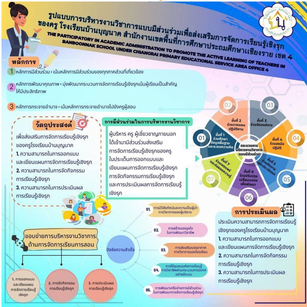
ภาพที่ 2 รูปแบบการบริหารงานวิชาการแบบมีส่วนร่วมเพื่อส่งเสริมการจัดการเรียนรู้เชิงรุกของครู โรงเรียนบ้านบุญนาค สำนักงานเขตพื้นที่การศึกษาประถมศึกษาเชียงราย เขต 4