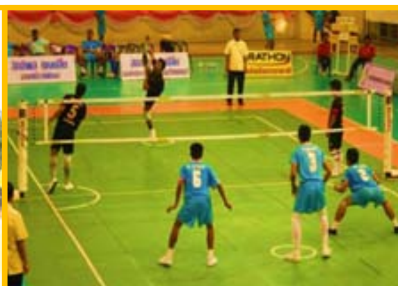
ภาพที่ 3 : แสดงการเล่นตะกร้อข้ามตาข่าย