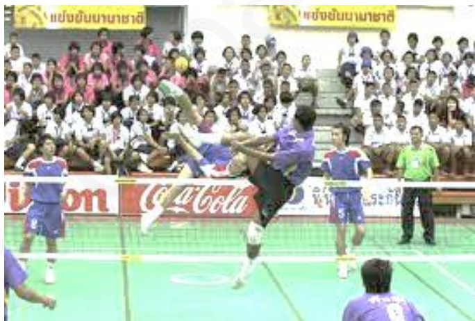
ภาพที่ 6 : แสดงมารยาทของผู้เล่นและผู้ชมกีฬาเซปักตะกร้อที่ดี