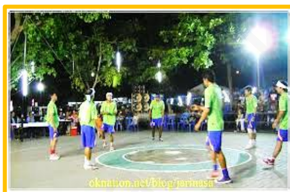
ภาพที่ 1 : แสดงการเล่นตะกร้อวง