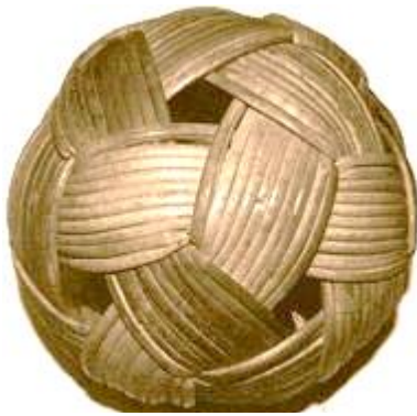
ภาพที่ 4 : แสดงตะกร้อหวาย

วัสดุที่ใช้ทำตะกร้อแตกต่างกันไปตามลักษณะของแต่ละประเทศ ส่วนใหญ่นิยมใช้หวายสานทำเป็นตะกร้อ แต่ในปัจจุบันกีฬาตะกร้อเป็นที่นิยมกันมาก จึงมีการวิจัยและทดลองทำตะกร้อจากวัสดุอื่นๆ เช่นพลาสติก หรือ PVC มีลักษณะแข็ง แต่มีความยืดหยุ่นดี และมีน้ำหนักเบากว่าตะกร้อหวาย จึงทำให้ตะกร้อหวายหายากไป ทำให้มีคนนิยมหันมาเล่นตะกร้อพีวีซีกันมาก