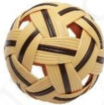
ภาพที่ 5 : แสดงตะกร้อพลาสติก