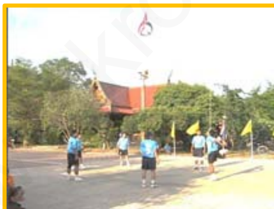
ภาพที่ 2 : แสดงการเล่นตะกร้อลอดห่วง

ที่มา : www : thaweesak-swu162.blogspot.com