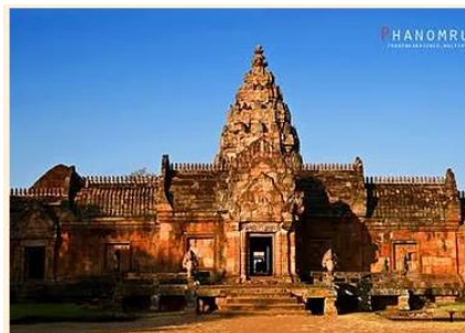
ภาพที่ 1 โบราณสถาน