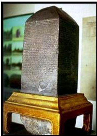
ภาพที่ 3 หลักฐานที่เป็นลายลักษณ์อักษร

2.2.2 เอกสารพื้นเมือง เอกสารพื้นเมืองนับได้ว่าเป็นหลักฐานทางประวัติศาสตร์ที่เป็นลายลักษณ์อักษรที่สำคัญของประเทศไทย มักปรากฏในรูปหนังสือสมุดไทย และเรียกชื่อแตกต่างกันออกไป เช่น ตำนาน พงสาวดาร จดหมายเหตุ ดังมีรายละเอียด ดังนี้