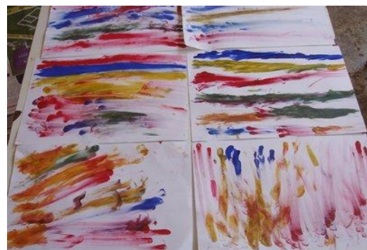
ตัวอย่าง การลูบสี