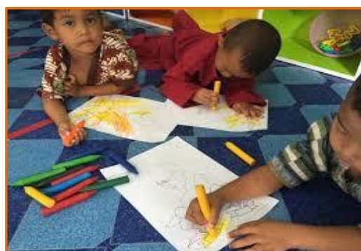
ตัวอย่างภาพวาดและการระบายสีด้วยสีเทียน