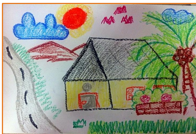
ตัวอย่างภาพวาดและการระบายสีด้วยสีเทียน