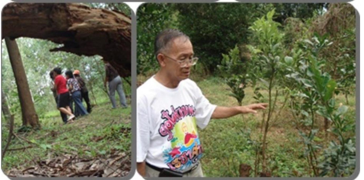
คนปลูกต้นไม้ ต้นไม้ก็ให้ผลตอบแทนแก่คน นี่คือธรรมชาติ เมื่อคนทำลายต้นไม้ ทำลายธรรมชาติ ธรรมชาติก็เอาคืนโดยสร้างความเดือดร้อนให้คน สรรพสิ่งล้วนพันเกี่ยวจริงๆ ครับ