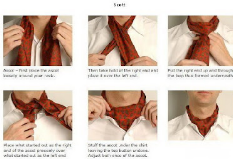
วิธีผูกผ้าพันคอ แบบ Scott