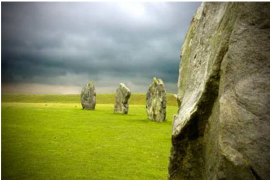
อะเวอบิวรี ประเทศอังกฤษ

ซึ่งความจริงแล้วยังมีสถานที่บางแห่ง ที่นักท่องเที่ยวอาจนึกไม่ถึง แต่ถึงดงามไม่แพ้สิ่งมหัศจรรย์เหล่านั้น ในหนังสือชื่อ The Road Less Travelled ของ บิล ไบรสัน เขาเขียนถึงสถานที่ท่องเที่ยวที่ถูกจัดอันดับไว้เกินจริง พร้อมกับแนะนำสถานที่ทางเลือกไว้ดังนี้