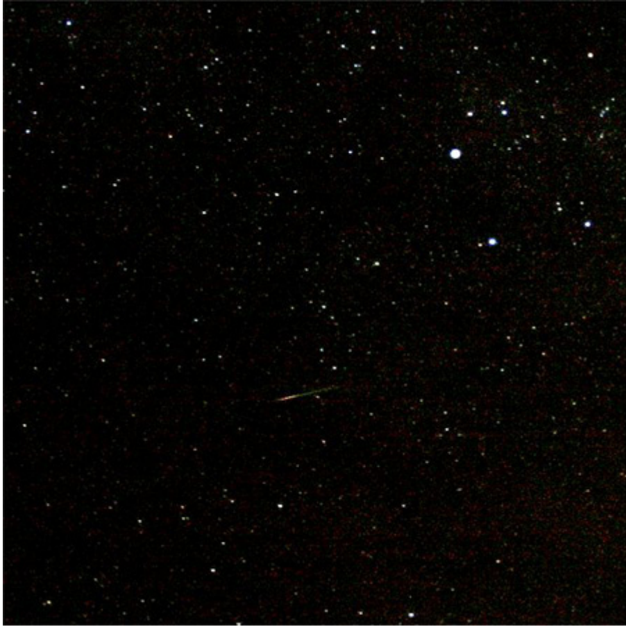
ภาพถ่าย ฝนดาวตก ไอโรไนด์ส์