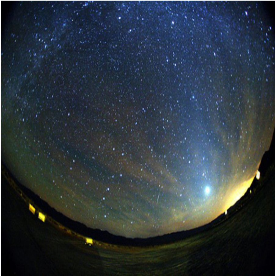
ภาพถ่าย ฝนดาวตก ไอริโอไนด์ส์