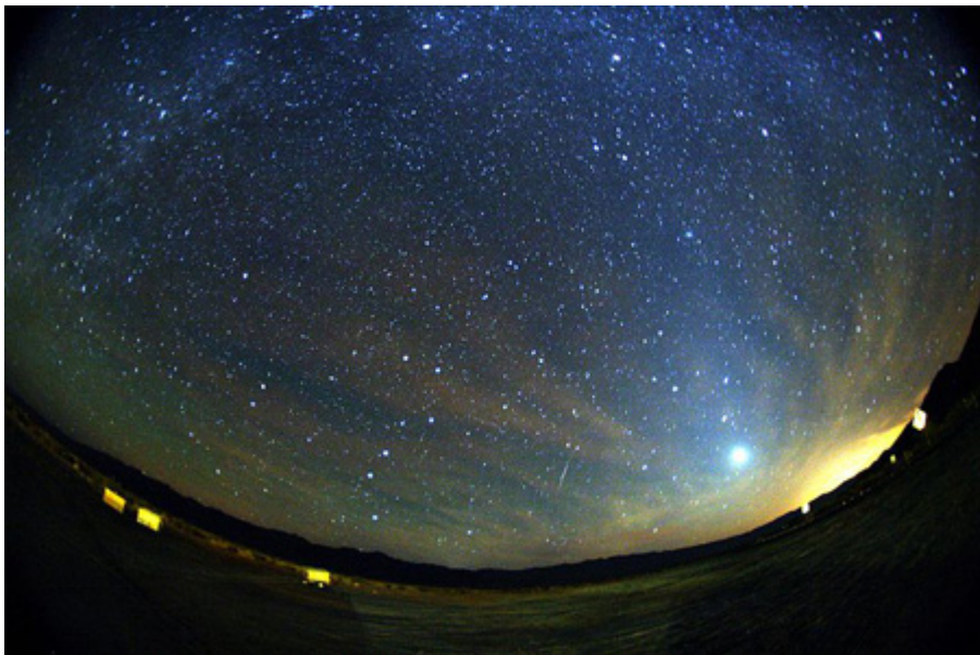
ภาพถ่าย ฝนดาวตก ไอริโอไนด์ส์