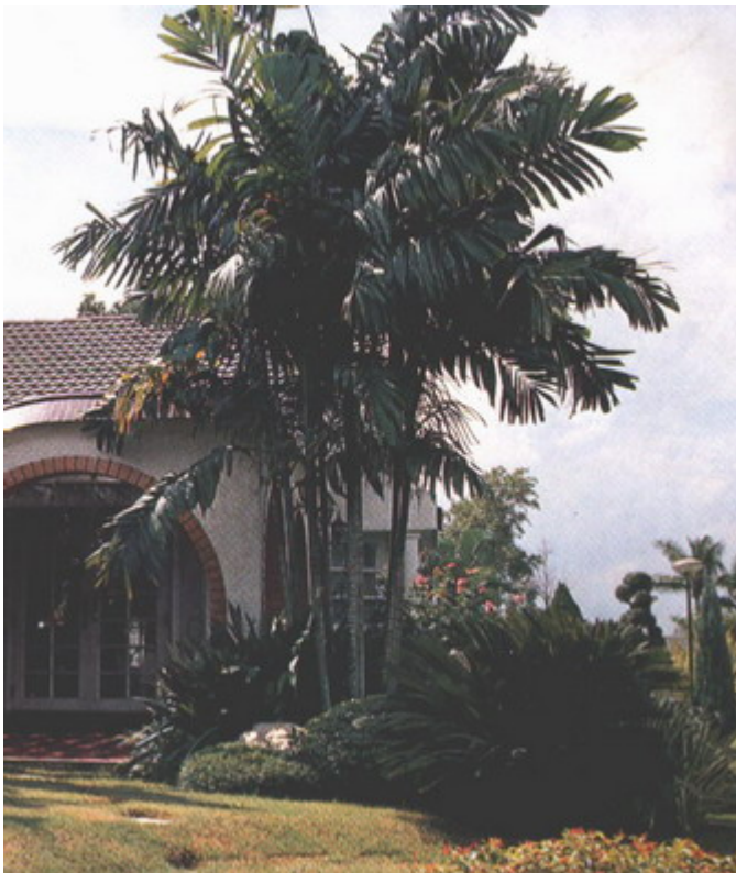
หมากเขียว และหมากต่างๆรวมทั้งปาล์มจะปลูกประดับมากกว่า หวังร่มเงาไม่ได้