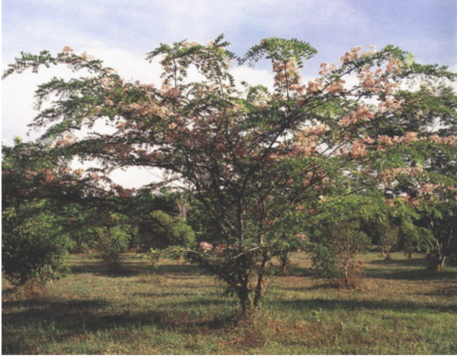
ชัยพฤกษ์ ทรงกิ่งจะบานออกหน่อย แต่ไม่สูง