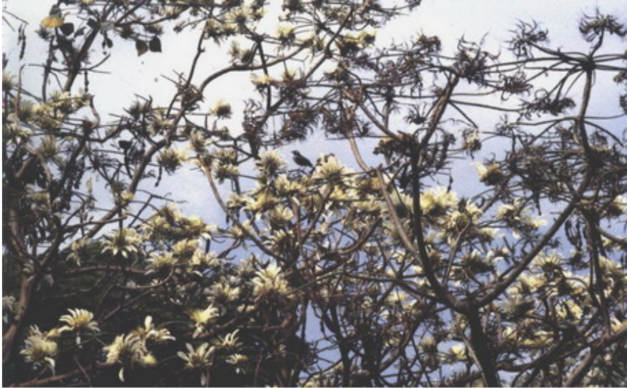
ทองหลางดำ ต้นมีหนามแต่ใบลายสวย ออกดอกก็สวย