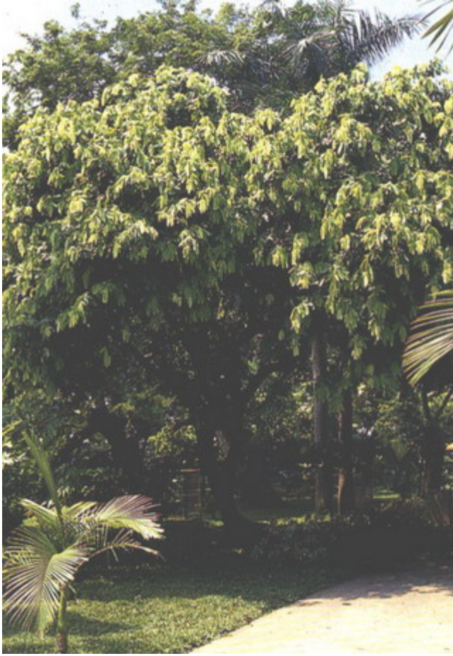
อโศกหน้า พุ่มหนาที่บมาก