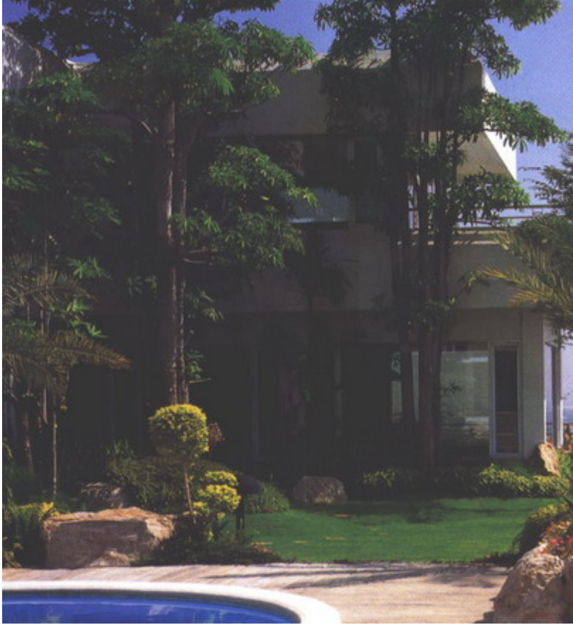
พญาสัตตบรรณ สูงโปร่ง ทรงสวยสง่า