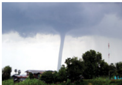
พายุภาคเล่หน้า บริเวณบึงบอระเพ็ด จ.นครสวรรค์

ประเทศไทยได้เจอกับปรากฏการณ์พายุวงช้างอยู่บ่อยครั้ง ทั้งที่เป็นเหตุการณ์ที่เกิดขึ้นได้แต่ไม่บ่อยนัก ซึ่งเมื่อช่วงเดือนกรกฎาคม 2551 มีพายุวงช้างเกิดขึ้นที่ชายฝั่งทะเลอันดามัน และล่าสุดก็มีการเกิดพายุวงช้างที่บริเวณบึงบอระเพ็ด จ.นครสวรรค์ เมื่อวันที่ 9 กันยายน 2551 ที่ผ่านมา