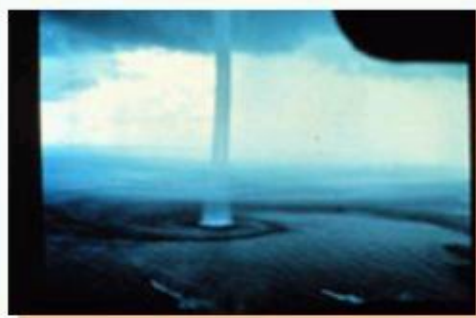
พายุภาคเล่หน้าที่เกิดขึ้นใกล้กับฟลอริดา

แบบแรก : เป็นพายุทอร์นาโดที่เกิดขึ้นเหนือผืนน้ำ (ซึ่งอาจจะเป็นทะเล ทะเลสาบ หรือแอ่งน้ำใดๆ) โดยพายุทอร์นาโดจะเกิดขึ้นระหว่างที่ฝนฟ้าคะนองอย่างหนัก เรียกว่า พายุฝนฟ้าคะนองแบบซูเปอร์เซลล์ (supercell thunderstorm) และมีระบบอากาศหมุนวนที่เรียกว่า เมโซไซโคลน (mesocyclone) พายุภาคเล่หน้าแบบนี้จึงเรียกว่า ภาคเล่หน้าที่เกิดจากทอร์นาโด (tornadic waterspout) ซึ่งใครที่เคยชมภาพยนตร์เรื่อง ทวิสเตอร์ (Twister) คงพอจะนึกภาพออก