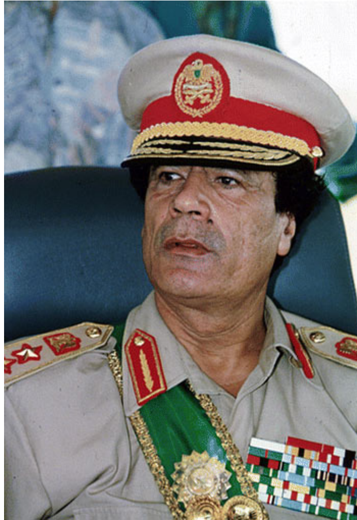
มูอัมมาร์ อัล กัดดาฟี (Muammar Al-Gaddafi)

ดูภายนอก นาซาร์ อัล อัซซัด ดูไม่เหมือนจอมเผด็จการสักนิด เพราะเขาได้อำนาจมาจากพ่อผู้นำจอมเผด็จการตัวจริงเสียงจริง ซึ่งเรียกเขากลับมาฝึกหัดงานบริหารประเทศในปี 1994 ซึ่งตอนนั้นเขากำลังเรียนปริญญาโทในลอนดอน จนกระทั่งปัจจุบันอัล อัซซัด กลายเป็นคนกุมอำนาจด้านการทหารและหน่วยข่าวกรองอย่างเด็ดขาดผู้เดียวในซีเรีย และรัฐบาลเขายังมีส่วนเกี่ยวข้องกับการลอบสังหารบุคคลสำคัญในประเทศเลบานอน