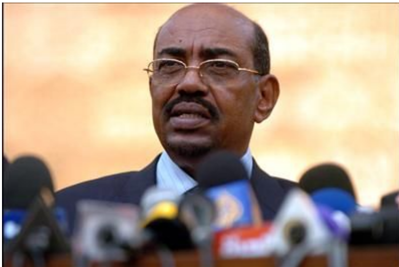
โอมาร์ อัล บาชีร์

หลังจากหมดยุคฮิตเลอร์ สตาลิน เหมาเจ๋อตุง พรพต ดาด้า ฮามิน แล้วโลกเราก็ไม่ยังสงบสุขซะทีเดียวเพราะผู้นำที่เป็นคนชั่ว คนเลว โครจิต โลก ปกครองประเทศอยู่เยอะ โกงกินประทุษร้ายมาก(แม่ปากบอกว่ารักชาติก็เถอะ) ผมเลยมารวบรวมผู้นำเผด็จการตัวเป้งๆ บนโลกบวมๆ ใหญ่ไว้วาถาประชาชนในประเทศนั้นขาดความสามัคคี จะเกิดอะไรขึ้น!!