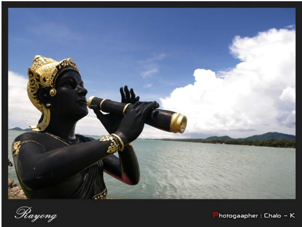
พระอภัยมณี