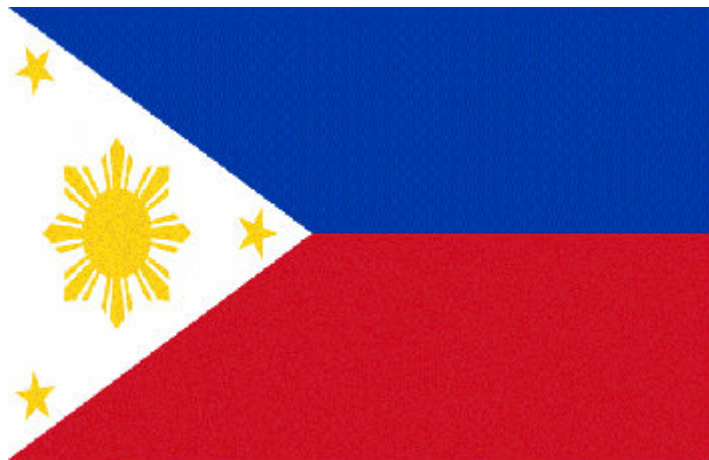
ฟิลิปปินส์ กุมस्ता