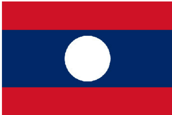
ลาว สะบายดี