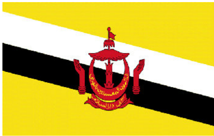
บรูไน ซาลามัต ดาตัง

ในปี 2558 ประเทศไทยก็จะก้าวเข้าสู่การเป็นประชาคมอาเซียน ซึ่งเมื่อถึงวันนั้นเราคงมีโอกาที่พบเจอเพื่อนต่างชาติกันมากขึ้น ดังนั้นวันนี้พี่แกป้าเลยนำเอาคำกล่าวทักทายของแต่ละประเทศมาให้ทำความรู้จักกัน