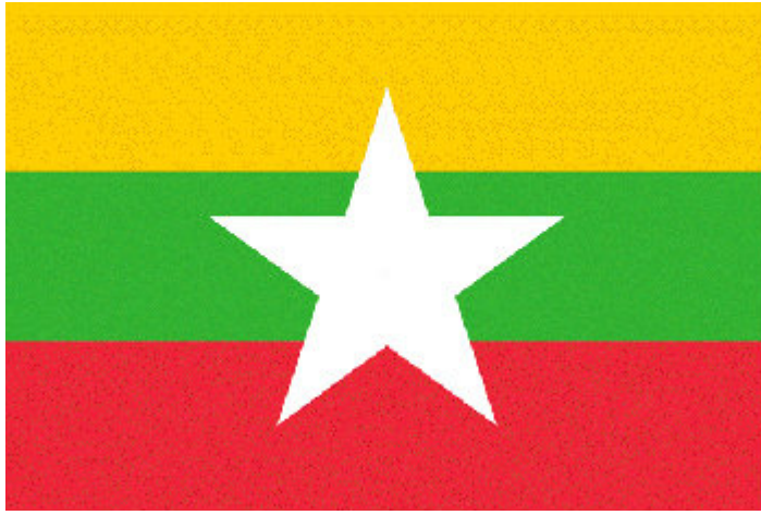
พม่า มิงกาลาบา