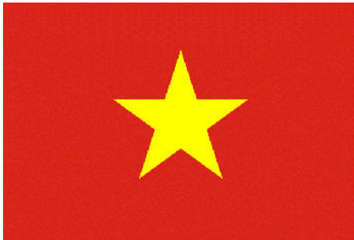
เวียดนาม ชินจ่าว

* อาเซียน (ASEAN) หรือ สมาคมประชาชาติแห่งเอเชียตะวันออกเฉียงใต้ (Association of Southeast Asian Nations) เป็นองค์กรที่ก่อตั้งขึ้นตามปฏิญญากรุงเทพฯ เมื่อวันที่ 8 สิงหาคม 2510 มีประเทศ สมาชิกรวม 10 ประเทศ แบ่งเป็นประเทศสมาชิกอาเซียนเดิม 6 ประเทศ คือ บรูไน ดารุสซาลาม อินโดนีเซีย มาเลเซีย ฟิลิปปินส์ สิงคโปร์ และไทย และประเทศสมาชิกอาเซียนใหม่ 4 ประเทศ คือ กัมพูชา ลาว พม่า และเวียดนาม หรือเรียกว่า กลุ่ม CLMV (Cambodia, Laos, Myanmar, Vietnam)