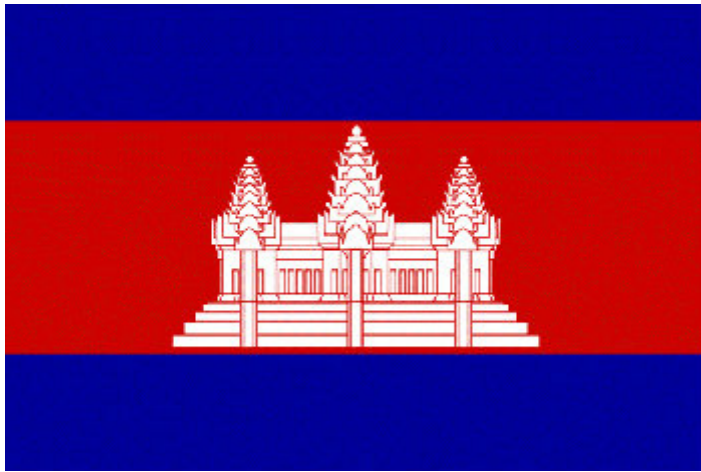
กัมพูชา ชั้วสเด