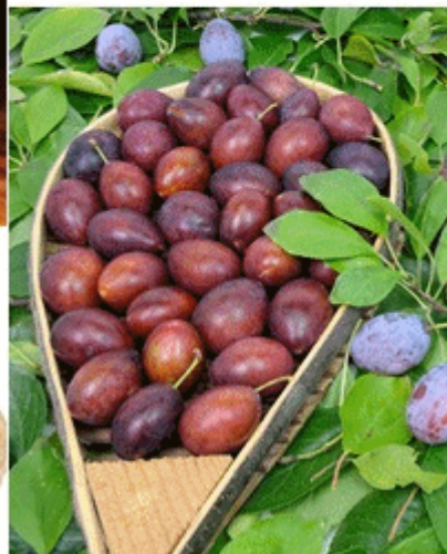
อาหารที่มีวิตามินบี 3