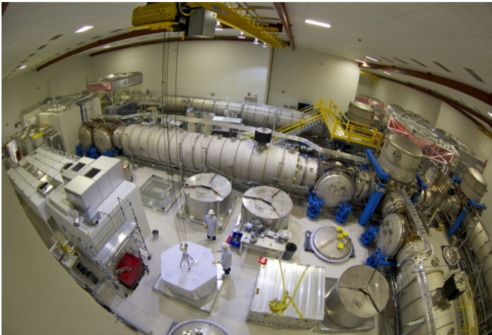
เครื่องสำรวจคลื่นความโน้มถ่วง Laser Interferometer Gravitational-wave Observatory (LIGO)

จากทฤษฎีของไอน์สไตน์ ความโน้มถ่วงไม่ได้เป็นแรงอีกต่อไป แต่เป็นผลจากการโค้งของกาล-อวกาศ(space-time) ซึ่งส่งผลต่อเส้นทางเคลื่อนที่ของอนุภาคอิสระ รวมทั้งแสง คลายกับการโยนลูกโบว์ลิ่งลงไปยังเตียงผาใบที่เตงตั้ง เมื่อวัตถุตกกระทบกับพื้นผิวก ก็จะไปยังใจกลาง เตียงผาใบนั้นจึงเปรียบได้กับกาล-อวกาศ