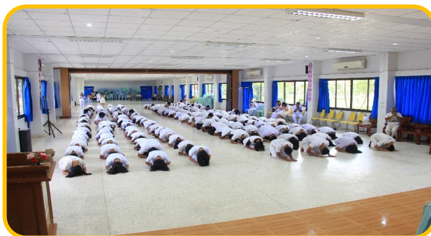
นักเรียนปฏิบัติธรรม