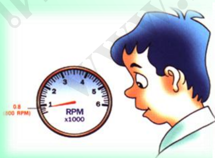
การใช้เวลาการใช้เงิน

นักเรียนในระดับชั้นมัธยมศึกษา เป็นระดับที่เหมาะสมสำหรับการเริ่มต้นวางแผนชีวิตในอนาคตตนเองไว้ก่อนล่วงหน้า จะทำให้มีโอกาสประสบความสำเร็จ และสมหวังในสิ่งที่คาดหวัง เราอาจวางแผนชีวิตไว้เองในหลายๆเรื่อง เช่น