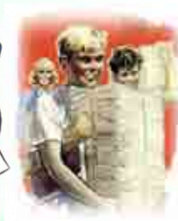
การเลือกวิชาเรียน