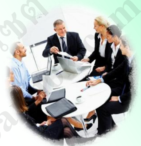
การทำงานอย่างมีความสุข

ฉะนั้น ยิ้ม เย็น ยอ ยอม ยึด 5 ย. นี้ จึงเป็นหัวใจของการสร้างมนุษยสัมพันธ์ในการทำงานและประกอบอาชีพให้ได้ผลดี หากได้เอาไปใช้ให้ถูกต้องตามกาลเทศะ