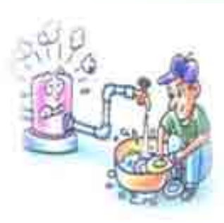
การเลือกงานอดิเรก