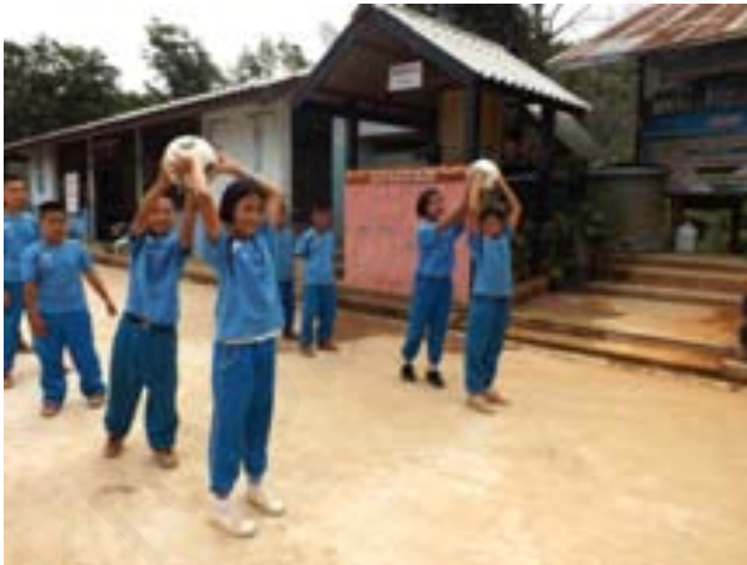
ภาพที่ 4 คนแรกส่งบอลเหนือศีรษะ