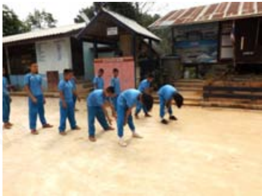
ภาพที่ 3 คนสุดท้ายได้บอลให้วิ่งมาข้างหน้าแล้วส่งบอลลอดขา