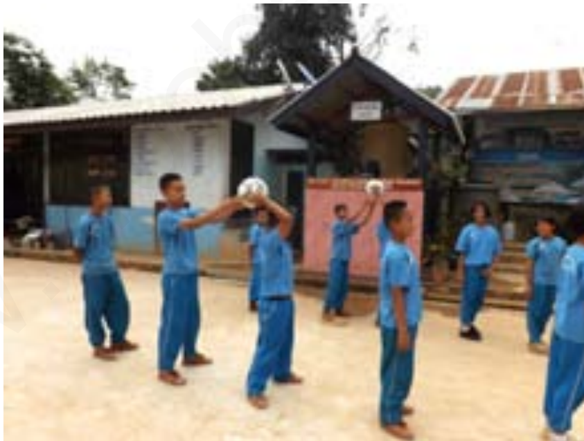
ภาพที่ 3 ส่งบอลเหนือศีรษะสลับกับลอดขาจนถึงคนสุดท้าย