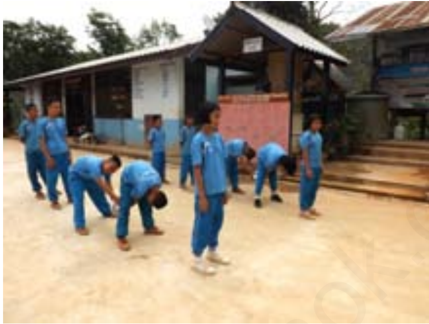
ภาพที่ 2 คนที่สองส่งบอลลอดขา