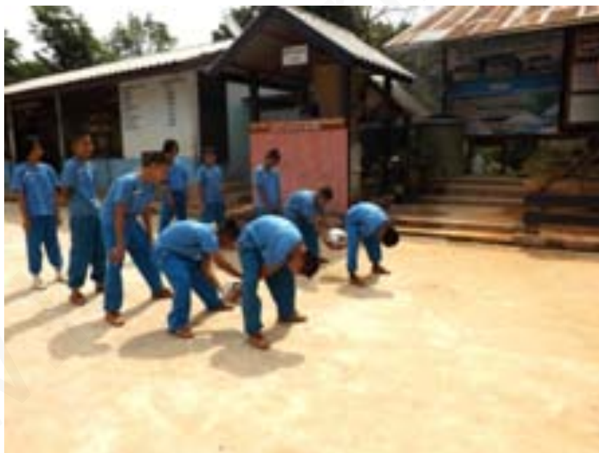
ภาพที่ 1 คนหน้าสุดส่งลูกบอลลอดขาให้คนที่สอง