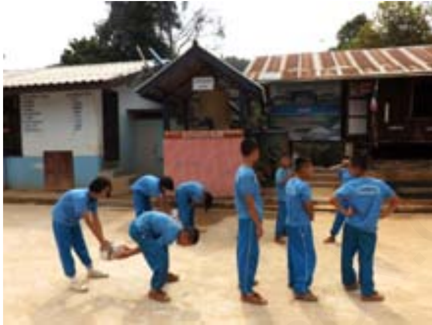
ภาพที่ 2 คนที่ต่อๆไปให้ทำลักษณะเดียวกัน