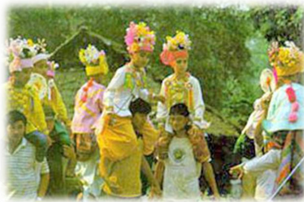
ภาพที่ ๘ : ประเพณีบวชลูกแก้วหรือปอยส่างลอง จังหวัดแม่ฮ่องสอน

ประเพณีบวชลูกแก้ว เป็นประเพณีของคนไตหรือชาวไทยใหญ่ ที่จังหวัด แม่ฮ่องสอน หรือ “ปอยส่างลอง” เป็นงานประเพณีบวชลูกแก้วของไทยใหญ่ เป็นการบรรพชาสามเณรให้สืบทอดพระพุทธศาสนา และเพื่อเรียนรู้พระธรรมคำสั่งสอน ของพระพุทธเจ้า โดยมีความเชื่อว่า ถ้าได้บวชให้ลูกของตนเป็นสามเณรจะได้านิสงส์ ๘ กัลป์ บวชลูกคนอื่นเป็นสามเณรได้อานิสงส์ ๔ กัลป์ และหากได้อุปสมบทลูกของตน เป็นพระภิกษุสงฆ์ จะได้านิสงส์ ๑๒ กัลป์ และได้อุปสมบทลูกคนอื่นจะได้านิสงส์ ๘ กัลป์ และเพื่อเป็นการสืบทอดประเพณีที่มีมาดั้งเดิม