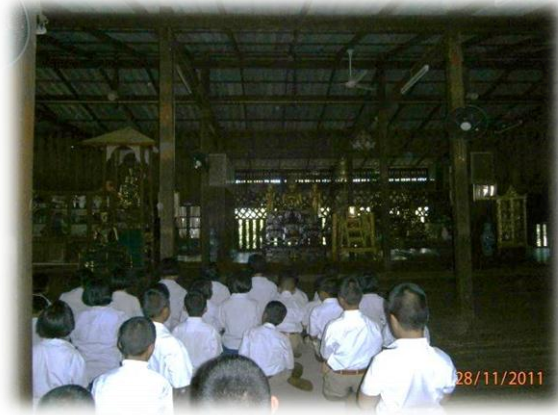
ภาพที่ ๓ : พิธีกรรมวันธรรมสวนะ (การประชุมฟังธรรม) ในวันพระ

๓. พระราชพิธีและรัฐพิธีต่าง ๆ มีพิธีกรรมทางพระพุทธศาสนาร่วมอยู่ด้วย