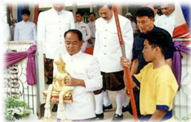
ภาพที่ ๑๐ : ประเพณีอุ้มพระดำน้ำ จังหวัดเพชรบูรณ์

ประเพณีอุ้มพระดำน้ำ เป็นประเพณีที่มีเพียงแห่งเดียวในประเทศไทย เกิดจากความเชื่อเกี่ยวกับอภินิหารของพระพุทธรูปสำคัญคู่บ้านคู่เมืองคือพระพุทธรูปทรงมารชา ซึ่งคนหาปลาสองสามีภรรยาทอดแหได้ที่วังเกาะระสารในบริเวณลุ่มน้ำป่าสักในเขตตัวเมืองเพชรบูรณ์ จึงนำไปไว้ที่วัดไตรภูมิ เมื่อถึงเทศกาลสารทพระพุทธรูปองค์นี้จะหายไปและชาวบ้านจะพบมาเล่นน้ำที่บริเวณที่ค้นพบเดิม ดังนั้นในเทศกาลทำบุญสารทหลังจากทำบุญเสร็จแล้วจะมีพิธีอัญเชิญพระพุทธรูปทรงมารชาลงริ้วขบวนเรือไปสงวนน้ำที่วังเกาะระสาร แต่ปัจจุบันนำมาทำพิธีที่ท่าหน้าของวัดโบสถ์ชนะมารในวันแรม ๑๕ ค่ำ เดือน ๑๐