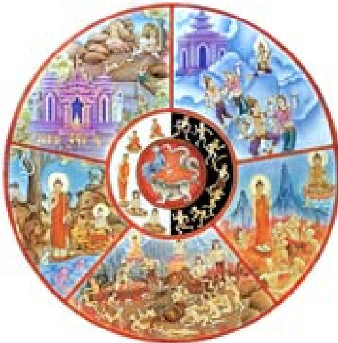
ภาพที่ ๑๘ : ภาพในวรรณคดีเรื่องไตรภูมิพระร่วง

วรรณคดีไทยถือว่าเป็นเอกลักษณ์อย่างหนึ่งที่อยู่กับประเทศไทยมาตั้งแต่สมัยอดีต ซึ่งจะเห็นได้จากผลงานจะมีในทุกยุคทุกสมัย และในเกือบทุกเรื่องนั้นจะเห็นได้ว่า จะมีพระพุทธศาสนาเข้ามามีอิทธิพลต่อเรื่องราวต่าง ๆ ในวรรณคดี เป็นเพราะคนไทยตั้งแต่สมัยอดีตมีความผูกพันกับศาสนามาก โดยเฉพาะศาสนาพุทธซึ่งได้ชื่อว่าเป็นศาสนาประจำชาติของไทย ดังเช่น วรรณคดี เรื่องไตรภูมิพระร่วง เป็นวรรณคดีทางพุทธศาสนาที่เก่าแก่และสำคัญเล่มหนึ่งของไทย อายุกว่า ๖๐๐ ปี แต่งขึ้นโดยพญาลิไทย (พระมหาธรรมราชาที่ ๑) พระมหากษัตริย์องค์ที่ ๔ แห่งราชวงศ์พระร่วง กรุงสุโขทัย เมื่อ พ.ศ. ๑๘๘๘ ทรงแต่งขึ้นเพื่อเทศนาแก่พระมารดา และสั่งสอนประชาชน ได้ทรงแสดงข้อคิดเห็นเกี่ยวกับหลักธรรมในพระพุทธศาสนา ตลอดจนชี้ให้เห็นผลบาปและผลบุญที่คนทั้งหลายได้กระทำไว้