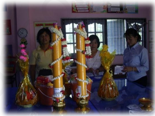
ภาพที่ ๑๑ : ประเพณีแห่เทียนพรรษา