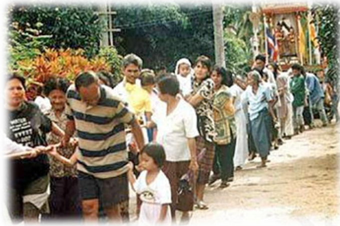
ภาพที่ ๑๕ : ประเพณีลากพระ จังหวัดนครราชสีมา