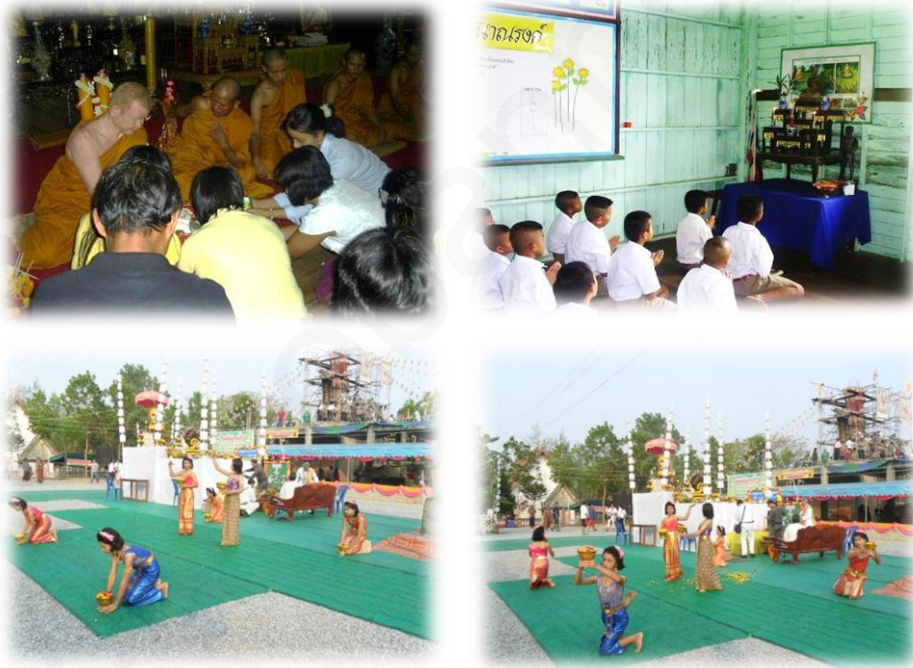
ภาพที่ ๑๕ : ภาพแสดงเอกลักษณ์ไทย

พระพุทธศาสนาเจริญรุ่งเรืองมาตั้งแต่สมัยสุโขทัยจนถึงปัจจุบัน วิถีชีวิตของคนไทยจึงได้เกี่ยวข้องกับพุทธศาสนา กิจกรรมทางพระพุทธศาสนาทุกกิจกรรมได้หล่อหลอมให้คนไทยมีลักษณะนิสัยเอื้อเฟื้อเผื่อแผ่ มีน้ำใจดี มีความเป็นมิตร ยิ้มแย้มแจ่มใส ซึ่งเป็นลักษณะที่โดดเด่นเป็นที่ประทับใจของชาวต่างชาติ เห็นได้ชัดเจนจากสิ่งต่าง ๆ ลักษณะการปฏิบัติ อันได้แก่ มรรยาทไทยและภาษาของชาวไทย