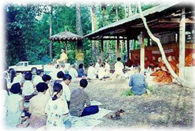
ภาพที่ ๑๔ : ประเพณีทำบุญโคนไม้ จังหวัดตราด

การทำบุญโคนไม้ เป็นประเพณีพื้นบ้านอย่างหนึ่งของจังหวัดตราดที่ทำเป็นประจำทุกปี สะท้อนให้เห็นถึงความสามัคคี ช่วยเหลือเกื้อกูลซึ่งกันและกันของคนในหมู่บ้าน ในชุมชน การทำบุญโคนไม้และการทำบุญตามสถานที่สำคัญในหมู่บ้าน นอกจากจะให้ผลในการดำเนินชีวิตโดยตรงแก่ผู้ใหญ่แล้ว ยังเป็นการปลูกฝังให้ลูกหลานของตนรู้จักรักป่า แผ่นดิน และพื้นน้ำ ไม่คิดที่จะทำลายธรรมชาติ ที่ตนต้องพึ่งพาอาศัยในขณะเดียวกันยังสอดแทรกคุณธรรมเรื่องความกตัญญูรู้คุณสืบทอดให้แก่ลูกหลานในหมู่บ้าน ให้รู้จักการทำบุญให้ทาน มีความเมตตาเอื้อเฟื้อ รู้จักรักผู้อื่น อันเป็นคุณธรรมหลักของการอยู่ร่วมกัน