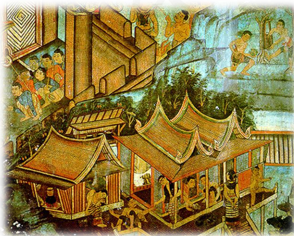
ภาพที่ ๑๗ : ภาพจิตรกรรมฝาผนังล้านนา