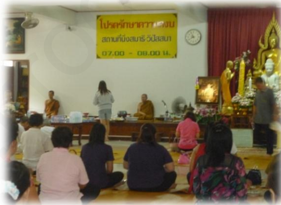
ภาพที่ ๔ : ทำบุญเนื่องในโอกาสวันคล้ายวันเกิด

๔. กิจกรรมทางสังคมทั้งหมดของประชาชนทั่วไป จะมีพิธีกรรมทางศาสนาแทรกอยู่ด้วยเสมอ เช่น การเกิด การขึ้นบ้านใหม่ การสมรส และงานฉลองต่างๆ ตลอดจนงานศพ ตั้งแต่เกิดเกิดจนตายก็ว่าได้