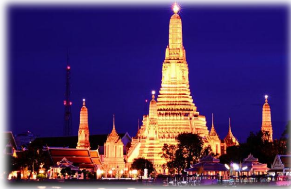
ภาพที่ ๑๖ : พระปรางค์วัดอรุณราชวราราม

วัดวาอารามต่าง ๆ สวยสดงดงาม ภาพจิตรกรรมฝาผนังที่งดงาม ละเอียดอ่อน เขียนเรื่องราวในพระพุทธศาสนา และชาดกต่าง ๆ