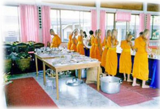
ภาพที่ ๙ : ประเพณีทานขันข้าวจังหวัดลำปาง