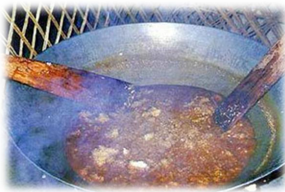
ภาพที่ ๑๓ : ประเพณีกวนข้าวทิพย์ จังหวัดชัยนาท

ประเพณีกวนข้าวทิพย์ จังหวัดชัยนาท ตามประวัติสมัยพุทธกาล เชื่อว่านางสุชาดา ได้นำข้าวทิพย์ หรือข้าวมธุปายาสถวายพระพุทธเจ้า ก่อนที่พระองค์จะได้ตรัสรู้ในวันเพ็ญเดือนสิบสอง ดังนั้นชาวพุทธจึงถือว่าข้าวทิพย์ หรือข้าวมธุปายาสเป็นอาหารทิพย์ และได้ทำถวายแด่พระสงฆ์ในฤดูก่อนเดือนสิบสอง