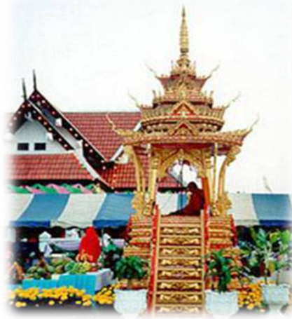
ภาพที่ ๑๒ : ประเพณีบุญผะเหวด จังหวัดร้อยเอ็ด