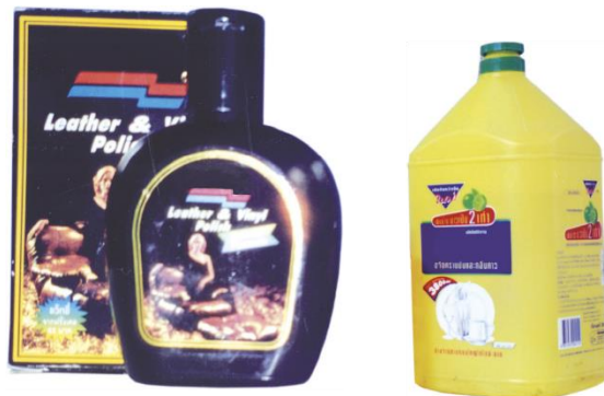
น้ำยาขัดหนัง น้ำยาล้างจาน