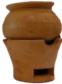
ภาพที่ เตาถ่าน