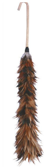
ไม้กวาดดอกหญ้า ไม้กวาดขนไก่