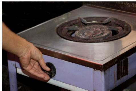
ภาพที่ เตาแก๊ส