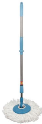
ม็อบเช็ดฝุ่น