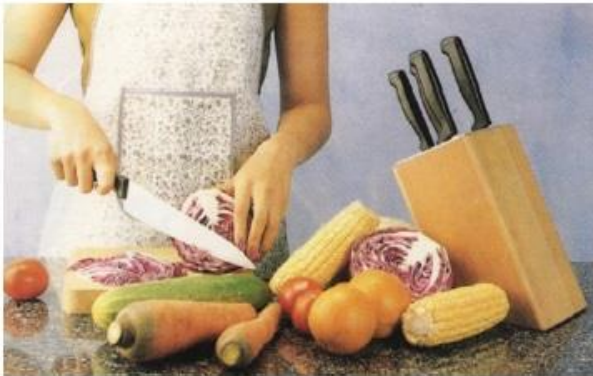
การใช้อุปกรณ์ในการทำงาน ควรแยกประเภทก่อนจัดเก็บ