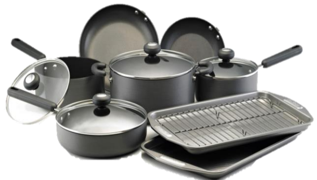
อุปกรณ์ที่ใช้ในการประกอบอาหาร