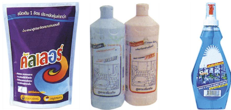
ผงซักฟอก น้ำยาขัดพื้น น้ำยาเช็ดกระจก