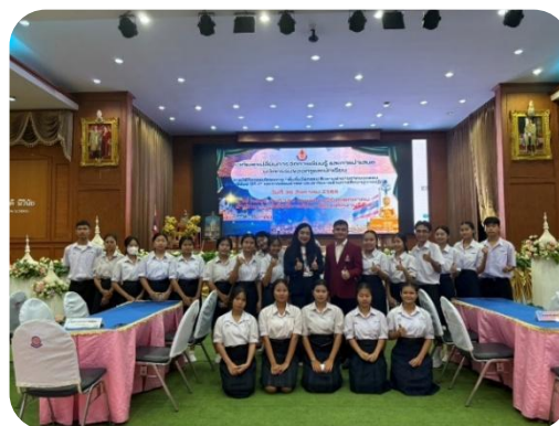
ภาพกิจกรรมแลกเปลี่ยนเรียนรู้ในงาน Open Class ของ สพม.บุรีรัมย์