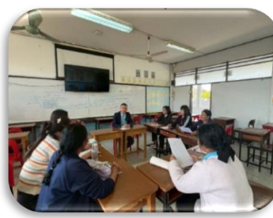
ภาพกิจกรรมแลกเปลี่ยนเรียนรู้ชุมชนแห่งการเรียนรู้ทางวิชาชีพ(PLC)