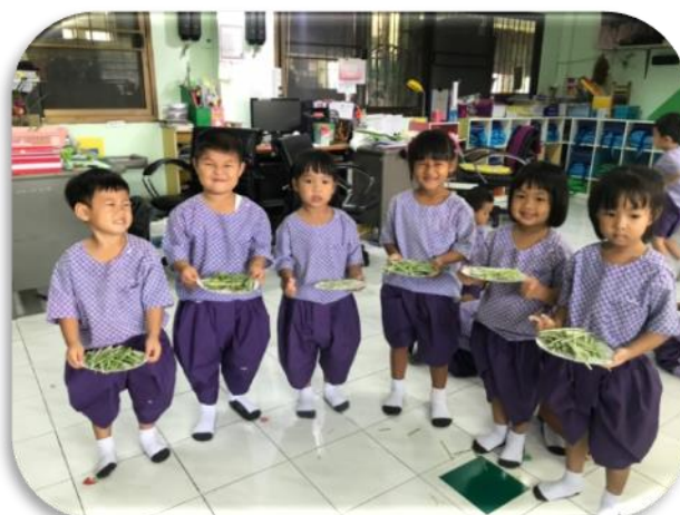
ขั้นตอนที่ 4 เด็กนักเรียนชื่นชมผลงาน ของตนเอง