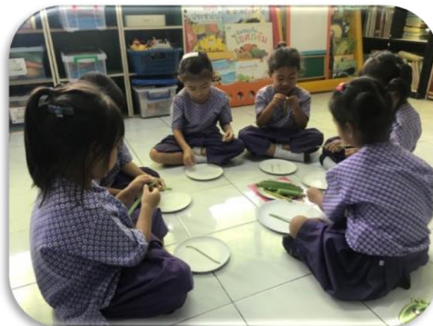
ขั้นตอนที่ 2 ครูแจกอุปกรณ์ ตามกลุ่ม