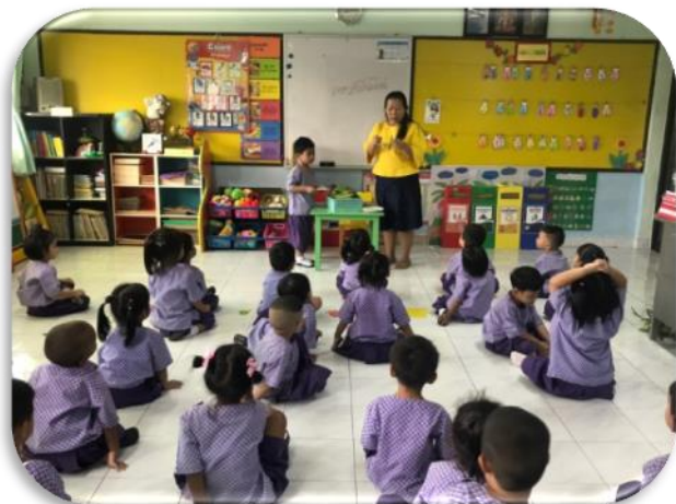
ขั้นตอนที่ 1 ครูแนะนำอุปกรณ์ และสาธิตการปฏิบัติกิจกรรม