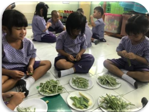
ขั้นตอนที่ 3 ครูให้เด็กนักเรียนลงมือ ปฏิบัติกิจกรรม