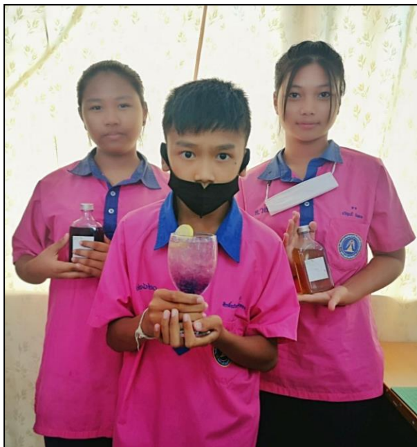
การเรียนการสอนรายวิชาकरणงานอาชีพ การลงมือปฏิบัติต้มน้ำสมุนไพร