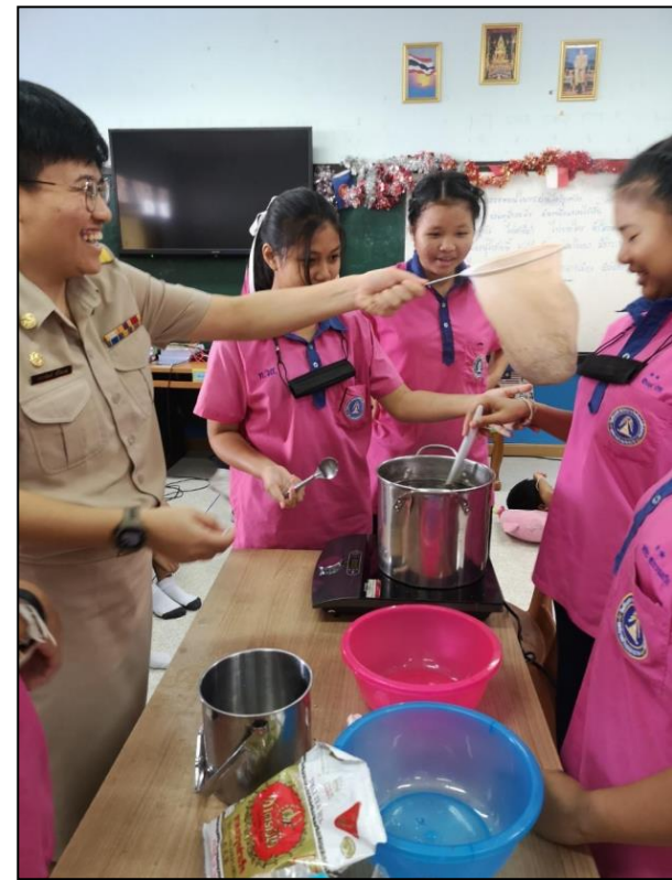
การเรียนการสอนรายวิชาการงานอาชีพ การลงมือปฏิบัติต้มน้ำสมุนไพร