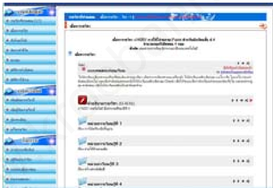
เนื้อหา บทเรียนบนเครือข่ายอินเทอร์เน็ต เรื่องการใช้โปรแกรม Paint มีจำนวน 4 หน่วย