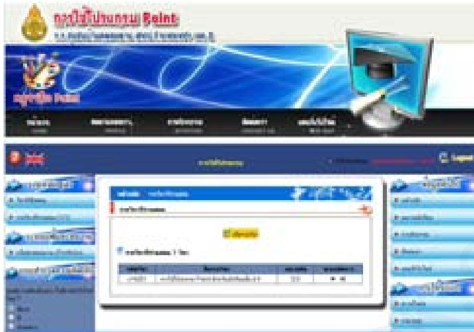
แสดงการรายวิชาที่จัดการเรียนรู้อบบการเรียนบนเครือข่ายอินเทอร์เน็ต เรื่องการใช้โปรแกรม Paint