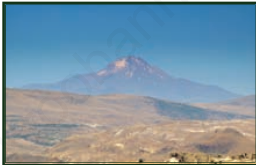
ที่ราบสูงอานาโตเลียในประเทศตุรกี

5. เขตที่ราบสูงตอนใต้และตะวันตกเฉียงใต้ เป็นเขตที่ราบสูงหินเก่าที่อยู่ในบริเวณคาบสมุทร เป็นที่ราบสูงขนาดใหญ่ทางตอนใต้ของทวีป ได้แก่ ที่ราบสูงเดกกันในประเทศอินเดียลักษณะเด่นของที่ราบสูงเดกกันคือ เกิดจากการเคลื่อนตัวของแผ่นดินส่วนหนึ่งของทวีปแอนตาร์กติกาเคลื่อนขึ้นไปชนกับแผ่นดินทวีปเอเชียจนเกิดเป็นเทือกเขาสูง ส่วนที่ราบสูงอาหรับ (Arabia) ในคาบสมุทรอาหรับ เกิดจากการเคลื่อนตัวของเปลือกโลกทำให้เกิดแนวหุบเหวลึก เกิดเป็นทะเลแดง (Red Sea) นอกจากนี้ก็ยังมีที่ราบสูงอิหร่านในประเทศอิหร่านและอัฟกานิสถาน ที่ราบสูงอานาโตเลียในประเทศตุรกี ที่ราบสูงอาหรับในประเทศซาอุดี-อาระเบีย เป็นทะเลทรายมีลักษณะอากาศแห้งแล้ง