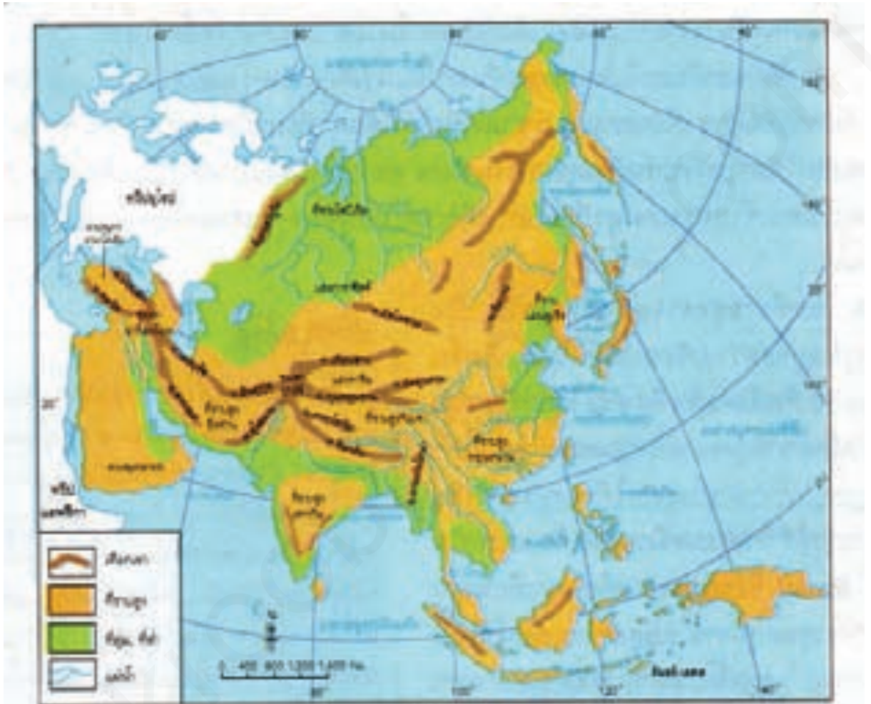
แผนที่ลักษณะภูมิประเทศของทวีปเอเชีย