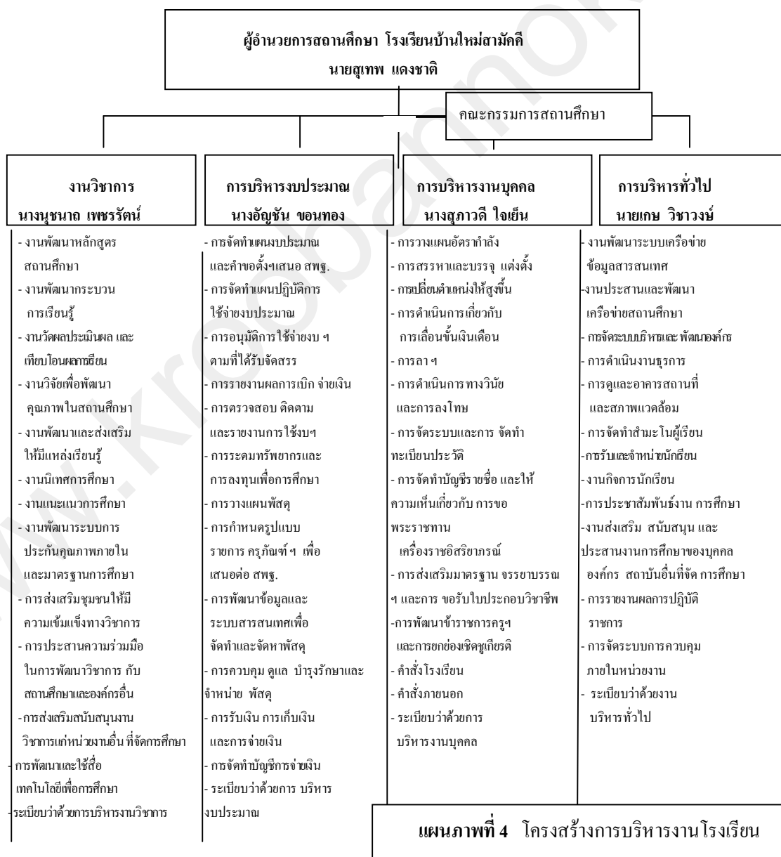
แผนภาพที่ 4 โครงสร้างการบริหารงานโรงเรียน