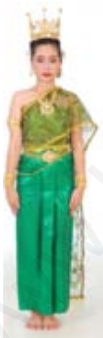
เจิวส่อง