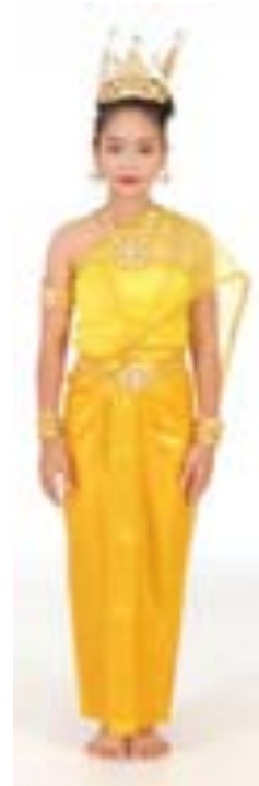
บุษราคัม