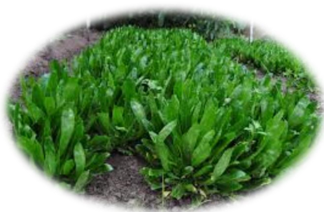
ภาพที่ 1 : ผักชีฝรั่ง

ผักชีฝรั่งเป็นพืชสมุนไพร ที่เป็นที่รู้จักกันดี เป็นพืชล้มลุก ลำต้นตั้งติดดิน มีถิ่นกำเนิดมาจากประเทศเม็กซิโกและทวีปอเมริกาใต้ เป็นที่นิยมปลูกกันทั่วไปๆ ในเมืองร้อน เป็นพืชสมุนไพรที่มีมาแต่โบราณ มีประโยชน์และสรรพคุณทางยา ให้นำมารักษาโรคต่างๆ ได้หลายอย่าง ผักชีฝรั่งจะมีกลิ่นหอมเฉพาะตัว และสามารถนำมาประกอบ ประุงอาหารเมนูต่างๆ ได้มากมายหลากหลายเมนู เป็นผักที่จะใช้ใบเป็นผักสด กินกับอาหารจำพวกปลาหรือกินแก้มักจะเข้ากันดี