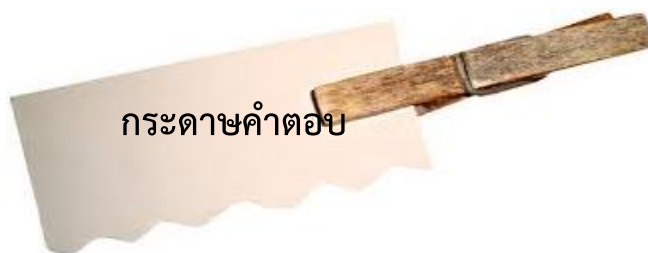
กระดาดำตอ