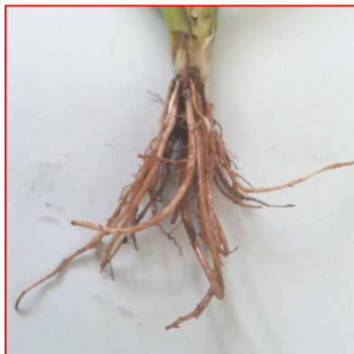
ภาพที่ 4 : รากผักชีฝรั่ง

รากผักชีฝรั่ง ระบบรากแก้ว รากมีลักษณะกลมเล็กๆ จะมีรากแขนง มีรากฝอย รอบๆ จะมีสีน้ำตาล มีกลิ่นหอมมีกลิ่นเฉพาะตัว