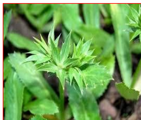
ภาพที่ 5 : ดอกผักชีฝรั่ง

ดอกผักชีฝรั่ง ออกเป็นช่อ ก้านช่อดอกยาว แตกกิ่งช่อดอกตรงปลาย ดอกเป็นกระจุกกลม สีขาวอมเขียว ตรงโคนช่อดอกมีใบประดับรูปดาว รองรับช่อดอกไว้