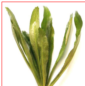
ภาพที่ 3 : ใบผักซีฝรั่ง

ใบผักซีฝรั่ง มีลักษณะใบรูปหอก ยาวรี มีใบออกรอบโคนต้น ไม่มีก้านใบ โคนใบสอบลง มีรอยหยักรอบนอกของขอบใบคล้ายฟันเลื่อย มีสีเขียวสด มีหนามอ่อนๆ ใบมีรสจืด มีกลิ่นหอมแรง ทำให้กลิ่นอาหารหอม ชวนให้น่ารับประทานมากยิ่งขึ้น