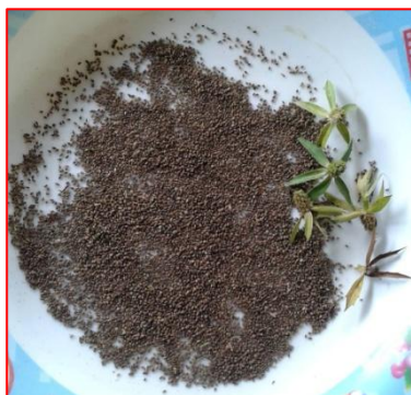
ภาพที่ 6 : เมล็ดผักชีฝรั่ง

เมล็ดผักชีฝรั่ง เป็นส่วนของผลผักชีฝรั่ง มีลักษณะกลมๆ ผลอ่อนจะมีสีเขียว เมื่อผลแก่จัดเปลี่ยนไปเป็นสีน้ำตาล เมื่อผลแห้งจะปริแตกออกเป็น 2 ซีก จะมีเมล็ดเล็กๆ อยู่ข้างในจำนวนมาก