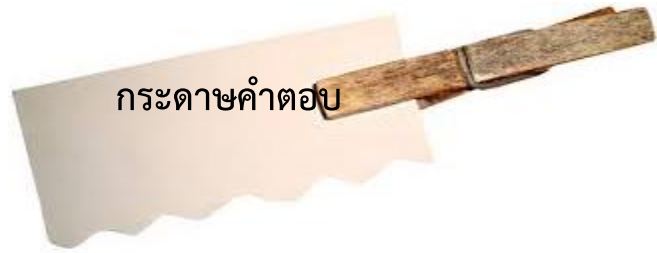
กระดาดคำตอป