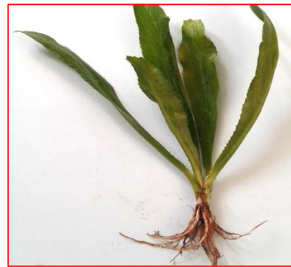
ภาพที่ 2 : ต้นผักซีฝรั่ง

ต้นผักซีฝรั่ง มีลักษณะกลมๆ ลำต้นเตี้ยติดดิน จะถูกห่อหุ้มไปด้วยใบ โดยรอบๆ โคนต้น ไม่มีก้านใบ ต้นของผักซีฝรั่ง จะมีสีเขียว และมีกลิ่นหอม