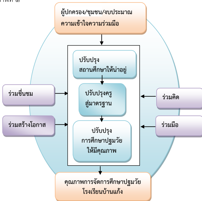
แผนภาพที่ ๑ รูปแบบการบริหารสถานศึกษาแบบ ๓ ป. ๔ ร่วม