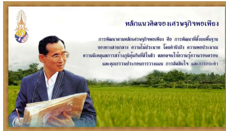
ภาพที่ 1 หลักแนวคิดของเศรษฐกิจพอเพียง