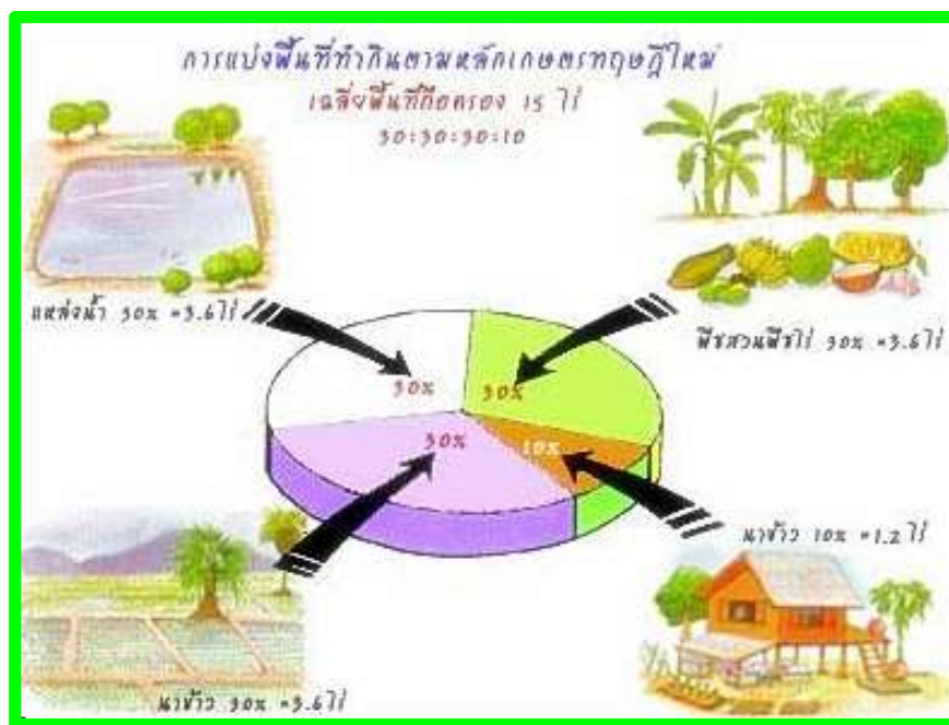
ภาพที่ 3 การแบ่งที่ดินทำกินตามหลักเกษตรทฤษฎีใหม่

บางคนยังเข้าใจว่าเศรษฐกิจพอเพียงเป็นเรื่องการปลูกพืชผัก หรือการทำเกษตรผสมผสาน นี่คือการเข้าใจที่ไม่ถูกต้องนัก จากการทำการสำรวจความรู้ ความเข้าใจของสวนดุสิตโพลในปี พ.ศ. 2548 พบว่ามีคนเข้าใจในลักษณะผิด ๆ นี้น้อยลง โดยคนไทยประมาณ 70 เปอร์เซ็นต์รู้จักเศรษฐกิจพอเพียงและเริ่มเข้าใจแล้วว่า ไม่ใช่เรื่องการแบ่งที่ดิน 30 : 30 : 30 : 10 ไม่ใช่เรื่องการปลูกพืชผักสวนครัว และไม่ใช่เรื่องที่ใช้ได้เฉพาะภาคเกษตรหรือเป็นเรื่องเกี่ยวกับเศรษฐกิจรากหญ้าเท่านั้น แต่เศรษฐกิจพอเพียงเป็นเรื่องของการดำเนินชีวิตของคนทั่วไป ส่วนการตีความและนำไปประยุกต์ใช้นั้นมีแนวคิดที่หลากหลาย