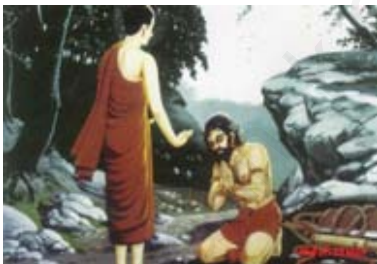
ภาพประกอบ 1.2 ตัวอย่างพุทธกิจในช่วงเช้า พระพุทธเจ้าเสด็จไปโปรดองคฺลิมาลเพื่อไม่ให้ฆ่ามารดาของตน

ตั้งแต่พระพุทธเจ้าทรงตรัสรู้จนกระทั่งปรินิพพานเป็นเวลา 45 ปี พระองค์ได้ทรงบำเพ็ญพุทธกิจเพื่อประโยชน์แก่ชาวโลกโดยไม่เห็นแก่ความเหน็ดเหนื่อย จนมีผู้บรรลุธรรมจำนวนมาก มีทั้งออกบวชเป็นภิกษุ ภิกษุณี ทำให้พระพุทธศาสนาเจริญรุ่งเรืองเป็นอย่างยิ่ง