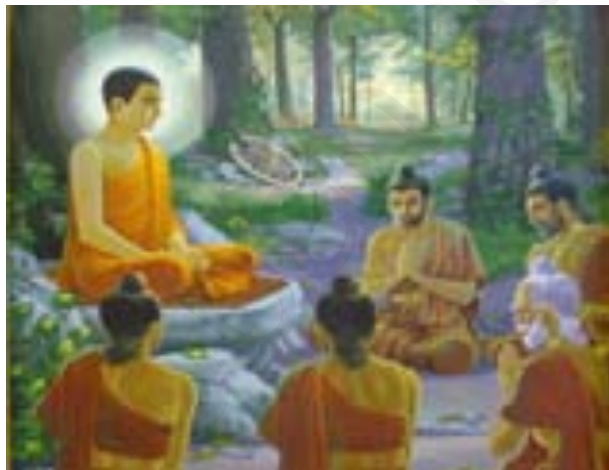
ภาพประกอบ 1.4 พระพุทธเจ้าทรงแสดงปฐมเทศนาโปรดปัญจวัคคีย์ทั้ง 5

วันแรกที่มีพระสงฆ์เกิดขึ้น คือ วันอาสาฬหบูชา และพระอรหันตสาวกองค์แรก คือ พระโกณฑัญญะ ซึ่งอยู่ในกลุ่มปัญจวัคคีย์ทั้ง 5