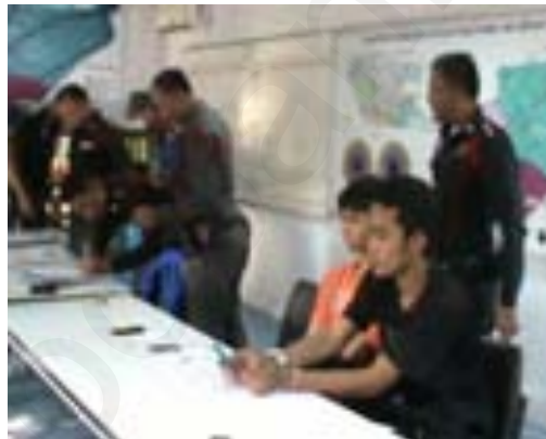
ภาพประกอบ 1.3 จับสองวัยรุ่นน้ายาบ้า