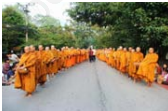
ภาพประกอบ 1.6 พระสงฆ์ในปัจจุบัน

พระสงฆ์เป็นผู้ปฏิบัติชอบตามพระธรรมวินัย และเป็นผู้สืบต่ออายุพระพุทธศาสนา