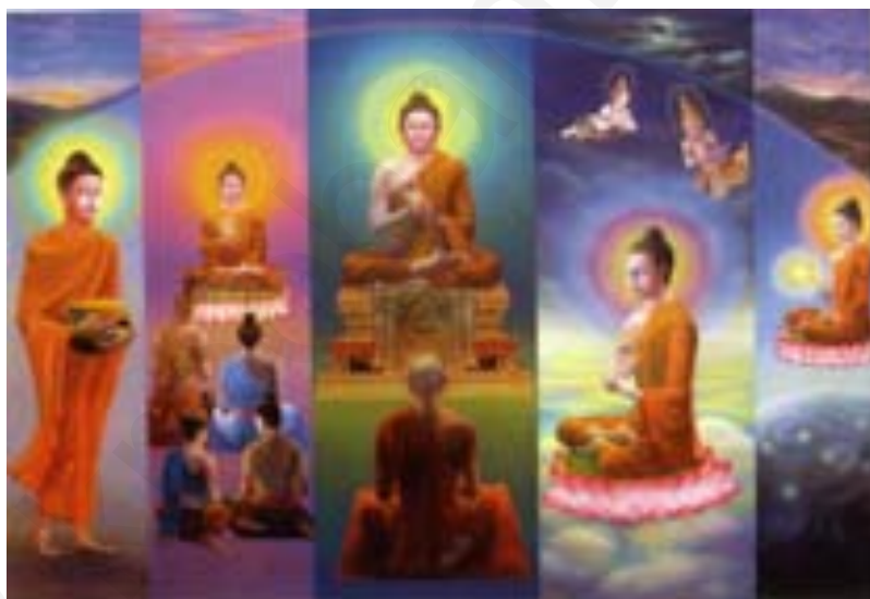
ภาพประกอบ 1.1 พุทธกิจประจำวันของพระพุทธเจ้า

พระพุทธ คือ สมเด็จพระสัมมาสัมพุทธเจ้า ผู้สั่งสอนทางแห่งความดับทุกข์ แก่มนุษย์ โดยพุทธกิจที่ทรงบำเพ็ญเพื่อโปรดสัตว์ เรียกว่า พุทธกิจ 5 ซึ่งเป็นกิจที่พระพุทธเจ้าทรงบำเพ็ญเป็นประจำทุกวัน แบ่งออกเป็น 5 เวลา ดังนี้