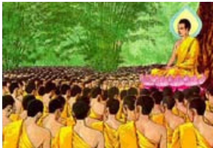
ภาพประกอบ 1.5 พระสงฆ์สาวก 1,250 องค์ มาประชุมพร้อมกันโดยมิได้นัดหมาย

ภายหลังจากพระพุทธเจ้าทรงประกาศพระพุทธศาสนาแล้ว ได้เกิดพระสงฆ์สาวกมากมาย พระสงฆ์เหล่านั้นได้มาประชุมพร้อมกันโดยมิได้นัดหมายในวันเพ็ญขึ้น 15 ค่ำ เดือน 3 ซึ่งถือเป็นวันสำคัญที่เรียกว่า วันมาฆบูชา ซึ่งเป็นวันที่พระพุทธเจ้าได้แสดงธรรมโอวาทปาฏิโมกข์ (นักเรียนจะได้ศึกษาในบทเรียนต่อไป)