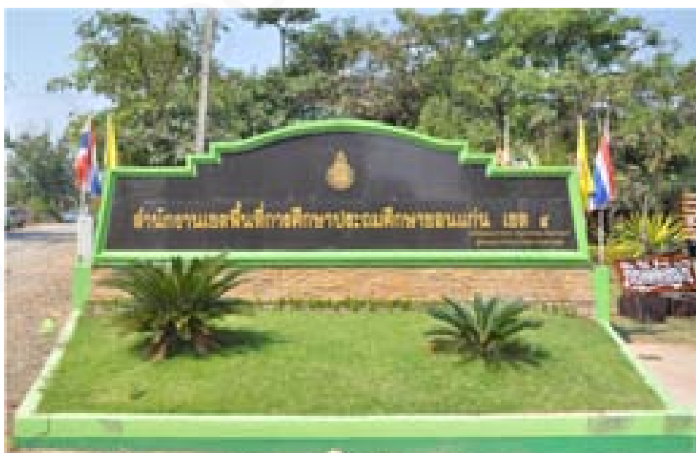
ภาพที่ 1 สำนักงานเขตพื้นที่การศึกษาประถมศึกษาขอนแก่น เขต 4