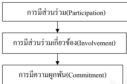
ภาพที่ 1 แสดงการมีส่วนร่วมในองค์กร

ภารกิจต่างๆเป็นผลให้บุคคลนั้นมีความผูกพัน (Commitment) ต่อกิจกรรมและองค์การในที่สุด ดังภาพที่ 1