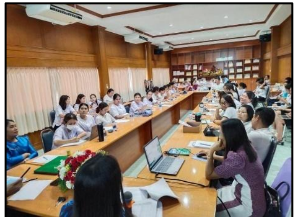
เผยแพร่ผ่านการประชุมของโรงเรียน