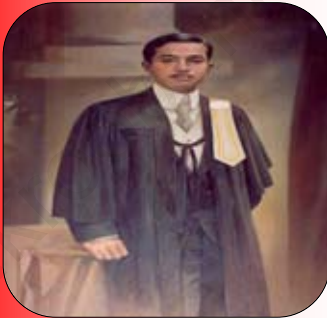
ภาพที่ 2 : พระเจ้าบรมวงศ์เธอ กรมหลวงราชบุรีดิเรกฤทธิ์

สรุปความหมายของกฎหมาย คือ “กฎระเบียบ ข้อบังคับที่สถาบันผู้มีอำนาจสูงสุดของประเทศตราขึ้นใช้บังคับรวมทั้งกฎระเบียบข้อบังคับที่เกิดจากจารีตประเพณีที่ได้รับการยอมรับนับถือจากสังคมหรือจากบุคคลทั่วไปที่อยู่รวมกันในสังคมเพื่อใช้กับบุคคลทุกคนในการบริหารประเทศหากไม่ปฏิบัติตามอาจได้รับโทษฐานตามฐานความผิดนั้น”