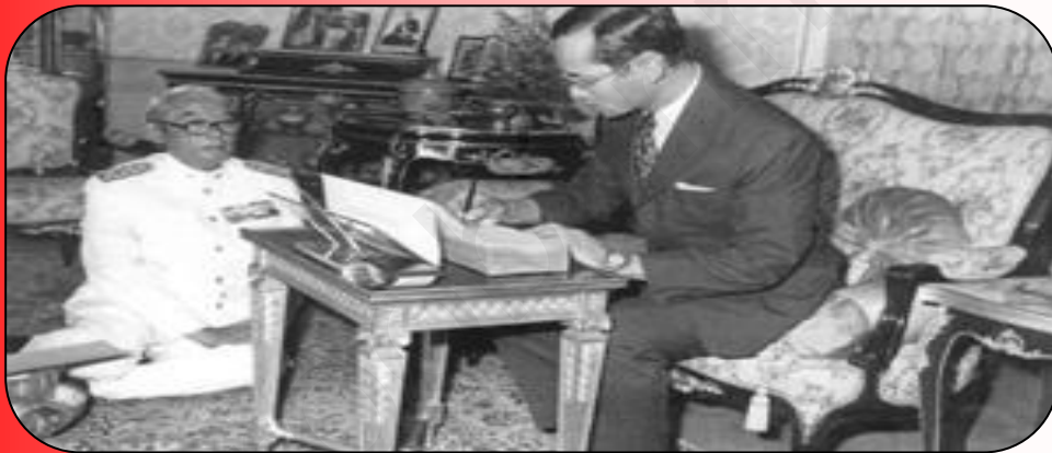
ภาพที่ 5 : พระบาทสมเด็จพระเจ้าอยู่หัวภูมิพลอดุลยเดช ทรงลงพระปรมาภิไธยในรัฐธรรมนูญแห่งราชอาณาจักรไทย พุทธศักราช 2550 เมื่อวันที่ 24 สิงหาคม พ.ศ. 2550

ประเทศไทยโดยเชื้อพระวงศ์และเจ้านายชั้นสูงได้ศึกษากฎหมายจากต่างประเทศทั้งที่เป็นลายลักษณ์อักษรและไม่เป็นลายลักษณ์อักษร ปัจจุบันประเทศไทยใช้กฎหมายลายลักษณ์อักษร (Civil Law) คือ ใช้ประมวลกฎหมายเป็นหลัก เช่น ประมวลกฎหมายอาญา ประมวลกฎหมายแพ่งและพาณิชย์ ประมวลกฎหมายวิธีพิจารณาความแพ่ง ประมวลกฎหมายที่ดิน ประมวลกฎหมายรัฐธรรมนูญ เป็นต้น อย่างไรก็ตามกฎหมายไทยนอกจากยึดกฎหมายที่เป็นลายลักษณ์อักษรแล้ว ทางด้านกฎหมายแพ่งและพาณิชย์ อันเป็นกฎหมายเอกชนยังบัญญัติให้กฎหมายไทยนำหลัก จารีตประเพณีแห่งท้องถิ่นของคนไทย รวมทั้งหลักกฎหมายทั่วไปมาใช้ได้ด้วยซึ่งบัญญัติไว้ดังนี้ “กฎหมายนั้นต้องใช้ในบรรดากรณีซึ่งต้องด้วยบทบัญญัติใด ๆ แห่งกฎหมายตามตัวอักษรหรือตามความมุ่งหมายของบทบัญญัตินั้น ๆ เมื่อไม่มีบทกฎหมายที่จะยกมาปรับคดีได้ ให้วินิจฉัยคดี นั้นตามจารีตประเพณีแห่งท้องถิ่นถ้าไม่มีจารีตประเพณีเช่นว่านั้น ให้วินิจฉัยคดีอาศัยเปรียบเทียบบทกฎหมายที่ใกล้เคียงอย่างยิ่งและถ้ากฎหมายเช่นนั้นไม่มีด้วย ให้วินิจฉัยตามหลักกฎหมายทั่วไป”