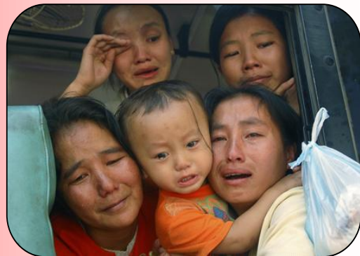
ภาพที่ 8 : ปัญหาผู้ลี้ภัยเป็นประเด็นทางมนุษยธรรมที่มีกฎหมายระหว่างประเทศเข้ามาเกี่ยวข้อง