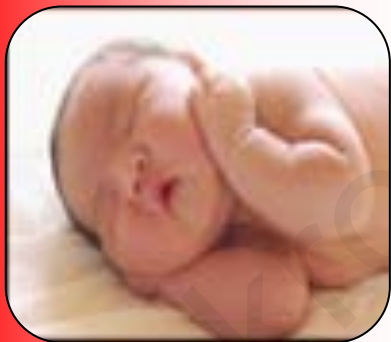
ภาพที่ 3 : การดำเนินชีวิตของบุคคล ย่อมเกี่ยวข้องกับกฎหมาย

1. เป็นกฎเกณฑ์ควบคุมความประพฤติของบุคคล ก่อให้เกิดความสงบเรียบร้อยกับสังคมและประเทศชาติทำให้บุคคลรู้ถึงสิทธิและหน้าที่ที่สามารถใช้สิทธิและทำหน้าที่โดยไม่ทำให้อื่นในสังคมต้องเดือดร้อน ได้แก่ บุคคลย่อมมีสิทธิในการประกอบอาชีพ แต่อาชีพที่ประกอบนั้นก่อให้เกิดความเดือดร้อนให้กับเพื่อนบ้านข้างเคียงกรณีเช่น กฎหมายย่อมเข้ามาควบคุมกระทำนั้นหรือควบคุมความประพฤติของบุคคลมิให้กระทำความผิด เช่น ลักทรัพย์ ปล้นทรัพย์ ฉ้อโกง ทำร้ายผู้อื่นหรือฆ่าผู้อื่นโดยเจตนา เป็นต้น เหล่านี้เป็นความผิดกฎหมายอาญาผู้กระทำความผิดจะต้องได้รับโทษ