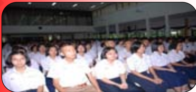
ภาพที่ 4 : ทุกคนมีสิทธิเข้ารับการศึกษาระดับขั้นพื้นฐานไม่น้อยกว่า 12 ปี

4. เป็นหลักในการพัฒนาคุณภาพชีวิตของบุคคลและสังคม คำว่าเป็นหลักในการพัฒนาคุณภาพชีวิตของบุคคลและสังคม หมายถึง กฎหมายมีบทบาทบัญญัติที่เป็นหลักและเป็นแนวทางการให้บุคคล ประชาชนหรือสังคมเดินตามนั้นเพราะมันแน่ใจว่านั่นเป็นการกระทำที่ถูกต้องและได้รับการรองรับจากรัฐทุกคนและสังคมยอมรับเป็นหนทางในการพัฒนาคุณภาพชีวิตที่มองเห็นอนาคตหลักของกฎหมายในการพัฒนาคุณภาพชีวิต คือ อำนาจอธิปไตย ได้แก่ อำนาจนิติบัญญัติ อำนาจบริหารและอำนาจตุลาการ ได้บัญญัติไว้ชัดแจ้งว่ากิจกรรมใดเป็นอำนาจของฝ่ายใด องค์กรและสถาบันต่างๆ ก็จะเดินตามหลักของกฎหมายนั้น ไม่ว่าจะเป็นสถาบันทางการเมือง สถาบันทางเศรษฐกิจ สถาบันทางสังคมหรือสถาบันศาสนา อาทิ กฎหมายวางหลักเกณฑ์ว่าให้บุคคลมีสิทธิได้รับการศึกษาอบรมขั้นพื้นฐานไม่น้อยกว่า 12 ปี โดยรัฐเป็นผู้จัดการศึกษาให้แก่ประชาชนอย่างทั่วถึงหลักเกณฑ์นี้เป็นหลักประกันว่า ประชาชนชาวไทยทุกคนมีสิทธิเข้ารับการศึกษาระดับขั้นพื้นฐานไม่น้อยกว่า 12 ปี คือถึงขั้นมัธยมศึกษาปีที่ 6 หรือบุคคลผู้มีอายุตั้งแต่ 60 ปี บริบูรณ์ขึ้นไปและไม่มีรายได้พอเพียงต่อการเลี้ยงชีพ รัฐจะต้องให้การช่วยเหลือเหล่านี้คือหลักประกันคุณภาพชีวิตหรือหลักในการพัฒนาคุณภาพชีวิตบุคคลในสังคมตามกฎหมาย