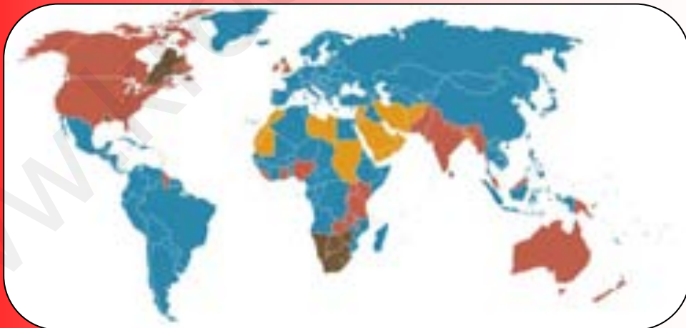
ภาพที่ 6 : แผนที่แสดงประเทศที่ใช้กฎหมายแบบ Civil Law

2. ระบบกฎหมายเป็นลายลักษณ์อักษร ภาษาอังกฤษเรียกว่า ซีวิลลอว์ (Civil Law) เป็นกฎหมายที่มีขั้นตอนในการจัดทำและมีการบันทึกไว้เป็นลายลักษณ์อักษรเป็นหมวดหมู่กฎหมายนี้พัฒนาจากกฎหมายชาวโรมันที่อาศัยอยู่ในกรุงโรม กฎหมายจะบัญญัติไว้เป็นลายลักษณ์อักษรในลักษณะตัวบท ผู้พิพากษาเป็นเพียงผู้ใช้กฎหมายนำเอาตัวกฎหมายมาปรับกับความผิดแล้วตัดสินความ พิพากษาความผิดไปตามต้วบทกฎหมายที่กำหนดและบัญญัติไว้เป็นลายลักษณ์อักษร กฎหมายซีวิลลอว์จึงรู้จักกันในอีกชื่อหนึ่งว่า กฎหมายประมวล (Code Law) คือ นำมารวมประมวลกันไว้เป็นหมวดหมู่บางที่ก็เรียกว่า กฎหมายลายลักษณ์อักษร (Written Law) ประเทศที่ใช้กฎหมายลายลักษณ์อักษรหรือซีวิลลอว์ เช่น ประเทศฝรั่งเศส เยอรมนี ญี่ปุ่น สวิตเซอร์แลนด์ อิตาลี สเปนและประเทศไทย เป็นต้น