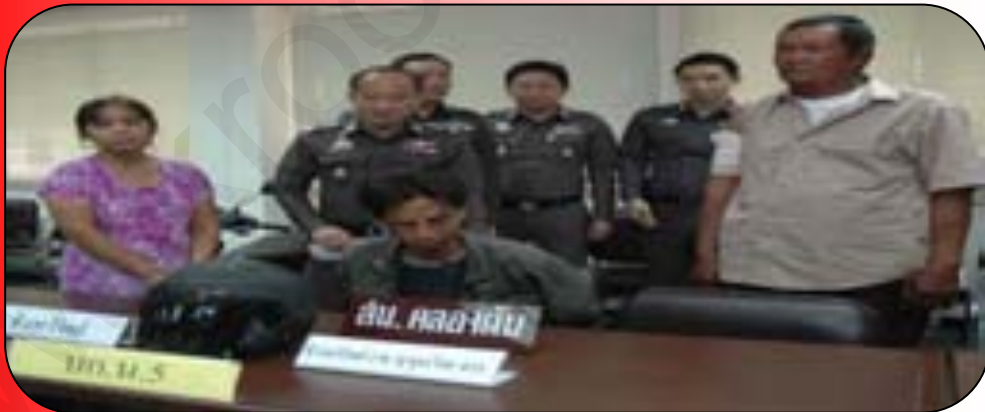
ภาพที่ 7 : ผู้ที่ไม่ปฏิบัติตามกฎหมายยอมได้รับโทษตามที่กฎหมายระบุ

อย่างไรก็ตาม คำว่ามีสภาพบังคับมิได้หมายถึงว่าบังคับให้ต้องรับโทษอย่างเดียว แต่ยังหมายถึงบังคับเพื่อป้องกันมิให้กระทำในสิ่งที่ไม่ถูกต้องและบังคับในลักษณะส่งเสริมให้บุคคลกระทำแต่ในสิ่งที่ถูกต้องและดีงามต่อสังคมด้วย