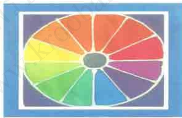
ภาพแสดงวงจรสีธรรมชาติ

การให้สีในการระบายผ้าบาติก ใช้หลักทฤษฎีสีเบื้องต้นของแม่สีวัตถุธาตุ เช่นเดียวกับการออกแบบในงานศิลปะ เพราะสีบาติกมีคุณสมบัติเช่นเดียวกับสีวัตถุธาตุ คือสามารถย้อม ทา แต้ม หรือระบายวัตถุอื่นให้มีสีเหมือนกับตัวมันได้ โดยยึดหลักการผสมสีตามทฤษฎีในงานศิลปะ ดังนี้