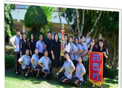
รับรางวัลชนะเลิศลีดเดอร์-กองเชียร์ ในงานToyota

1. ได้ลาภเสื่อมลาภ ลาภในที่นี้ หมายถึง ทรัพย์สินเงินทอง จะเห็นได้ว่าผู้ที่เกิดมาเป็นคนจน ต่อมาภายหลังกลายเป็นคนร่ำรวยก็มี คนที่ร่ำรวย แล้วกลายเป็นคนจนก็มี