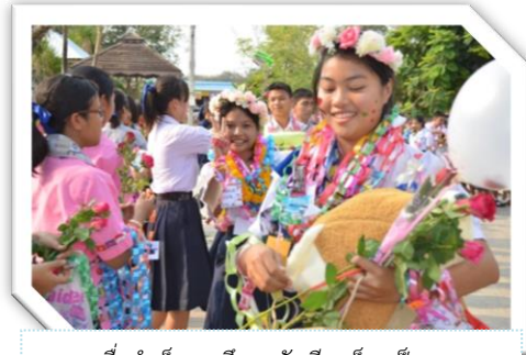
เมื่อสำเร็จการศึกษานักเรียนก็จะเป็นสุข

4. สุขกับทุกข์ ความจริงข้อนี้ก็ปรากฏ อยู่ทั่วไป แม้แต่มหาเศรษฐี มหาราชผู้มี อำนาจทางการเมือง ต่างก็มีสุขมีทุกข์คละเคล้า กันไปทั้งนั้น เมื่อสมหวัง คนก็มีสุข เมื่อผิดหวัง คนก็มีทุกข์ ไม่เคยมีใครสมหวังทุกเรื่อง และไม่เคยมีใคร ผิดหวังทุกเรื่อง ทุกคนไม่ว่าเด็กหรือผู้ใหญ่ เศรษฐีหรือยากจนต่างก็รู้ความจริงข้อนี้ดี