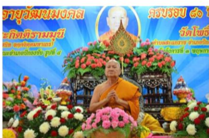
ฉลองอายุวัฒนมงคล ครบรอบ 80 ปี

3. นินทากับสรรเสริญ คนเราต่างจิตต่างใจกัน เมื่อทำอะไรลงไปอย่างหนึ่ง คนชอบก็มี คนไม่ชอบก็มี ที่ชอบก็สรรเสริญ ที่ไม่ชอบก็ติเตียน บางครั้งสิ่งที่เราทำไปขัดผลประโยชน์เขาโดยไม่รู้ตัว ก็จะถูกเขาตำหนิ บางครั้งไปอำนวยผลประโยชน์ให้เขาโดยเราไม่รู้ตัวก็จะได้รับคำสรรเสริญ ดังนั้น คนที่เคยตำหนิเราภายหลังกลับมาสรรเสริญก็มี คนที่เคยสรรเสริญกลับมาตำหนิก็มี เหล่านี้เป็นธรรมดาของโลก ไม่ว่าจะเป็สมัยใดก็เป็นอย่างนี้เสมอ