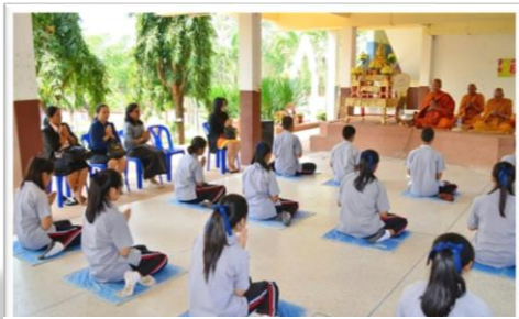
หมั่นฟังธรรมและนำไปปฏิบัติในชีวิตประจำวัน

ด้วยเหตุนี้ ทางพระพุทธศาสนาจึงสอนให้คนเราทำความรู้สึกถึงความจริงของโลกธรรม