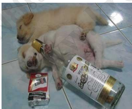
ภาพประกอบ 3 มิตรเทียม

3. มิตรหัวประจบ มีลักษณะ 4 ประการ คือ ทำชั่วก็เออออ ไม่ห้ามปราม ทำดีก็เออออ ไม่สนับสนุนจริงจัง ต่อหน้าก็สรรเสริญ ลับหลังก็นินทา