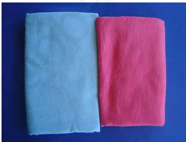
ภาพที่ 1.1 ผ้าฝ้าย