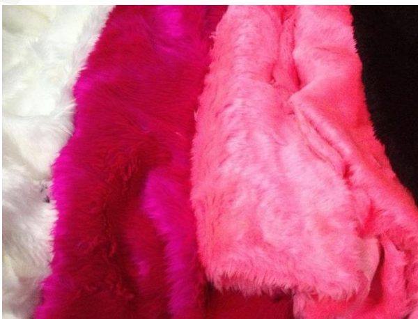
ภาพที่ 1.4 ผ้าขนสัตว์

การดูแลรักษาผ้าขนสัตว์ รอยเปื้อนสกปรกให้รีบแปรงออกโดยเร็ว หากเปื้อนน้ำให้รีบสะอาดออก พอผ้าแห้งใช้แปรง ๆ ออกอีกครั้งหนึ่ง ต้องแปรงทุกครั้ง ภายหลังสวมใส่แล้ว ใช้แปรง ๆ ออกอีกครั้งหนึ่ง ต้องแปรงทุกครั้ง ภายหลังสวมใส่แล้ว ใช้แปรงที่มีขนนุ่มและแน่น ซึ่งนอกจากจะทำให้รอยเปื้อนหลุดออกแล้ว ยังช่วยให้เส้นใยกลับสู่สภาพเดิมด้วย (มานี กลกิจรอดมไพศาล, 2557, หน้า 4)