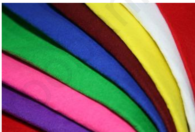
ภาพที่ 1.5 ผ้าไนลอน

การดูแลรักษาผ้าไนลอนผ้าไนลอน สีขาวนั้นซักง่ายแห้งเร็วและไม่ต้องรีด เหมาะที่จะใช้ตัดเครื่องแบบ แต่ก็มีปัญหาเรื่องคราบสกปรกเล็กๆ วิธีที่จะซักเสื้อผ้าไนลอนสีขาวให้มีสีขาวสะอาดดังเดิมก็คือซักผ้าไนลอนสีขาวตามธรรมชาติครั้งหนึ่ง ถ้าซักรวมกับผ้าสีหรือผ้าสกปรกจะทำให้ผ้าไนลอนสีขาวมีสีดำคล้ำลง ควรตากผ้าในที่ร่ม (จิตติรัตน์ เหมยจิตติ, 2542, หน้า 7)