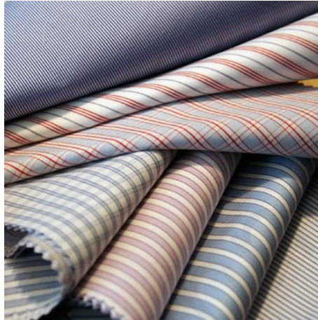
ภาพที่ 1.6 ผ้าใยสังเคราะห์

การดูแลรักษาผ้าใยสังเคราะห์ ที่นิยมใช้ทั่วไป คือ เรยอนและอาซิเตด ทั้งสองชนิดนี้มีปฏิกิริยาต่างกันเมื่อถูกความร้อน ผ้าอีกหลายชนิดประกอบขึ้นด้วยใยทั้งสองชนิด และยังผสมกับไนลอน ออร์ลอน เดครอน หรือใยธรรมชาติอื่น ๆ จะละลายเมื่อถูกความร้อนสูง จึงควรบั้งกับความร้อนให้อยู่ในช่วงสำหรับรีดเรยอนเสมอ (มาณี กลสิกรอุดมไพศาล, 2557, หน้า 4)