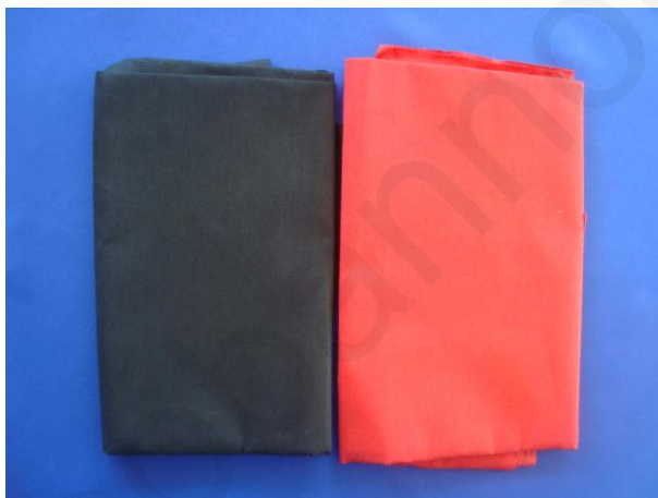
ภาพที่ 1.2 ผ้าลินิน

การดูแลรักษาผ้าลินิน ไม่ควรใช้จนกระทั่งเปื้อนมาก จะทำให้ซักยาก ผ้าสีขาวควรตากแดด ถ้าต้องการฟอกขาวควรใช้สารฟอกขาวประเภทเปอร์ออกไซด์อย่างอ่อน ไม่ควรลงแป้ง เพราะใยมีลักษณะแข็งอยู่แล้ว ลงครามได้ถ้าใช้บ่อย ๆ ผ้าที่ซักเก็บไม่ควรลงครามเพราะจะทำให้เกิดจุดด่างเหลือง ริดผ้าลินินเมื่อยังชื้นอยู่ ริดทั้งสองด้านอย่าให้มีรอยย่น (สาคร ชลสาคร, 2548) หน้า 16)