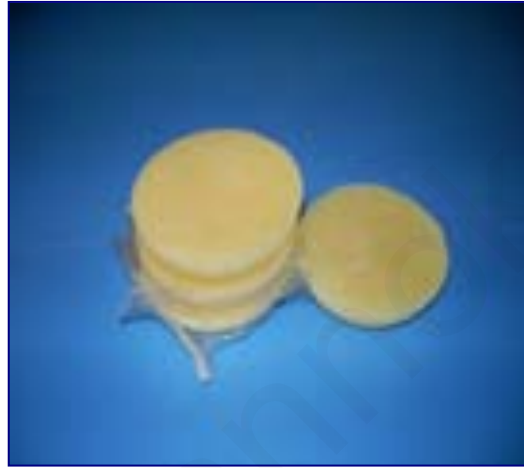
ภาพที่ 3 เทียนสำหรับทำบาติก

สีข้อมืออยู่หลายชนิดสีที่เหมาะสมกับการทำบาติกต้องใช้สีข้อมือเย็น ในน้ำสีที่มีอุณหภูมิประมาณ 30 องศาเซลเซียสและไม่ควรร้อนเกิน 40 องศาเซลเซียส ถ้าร้อนกว่านี้จะทำให้เทียนละลาย สีข้อมือร้อนซึ่งจะมีอักษรย่อ “H” ไม่เหมาะสมกับการข้อมือผ้าบาติกควรใช้สีที่มีอักษรย่อ “M” หรือ “M Dye” (นันทา โรจนอุดมศาสตร์, 2536, หน้า 73)