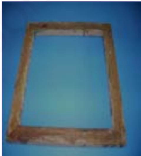
ภาพที่ 11 กรอบไม้ ที่มา (เสาวนีย์ เอกสินเสริม, 2556)

3. ไม้แทงปากกาเขียนเทียน เป็นอุปกรณ์ที่มีด้ามเป็นไม้ส่วนปลายเป็นเส้นลวดขนาดเล็กหรืออาจจะใช้สายกีตาร์เส้นเล็กๆ ใช้ส่วนที่เป็นเส้นลวดแทงที่ปลายท่อของปากกา (นภาพร โคนุชิต, 2548, หน้า 10)