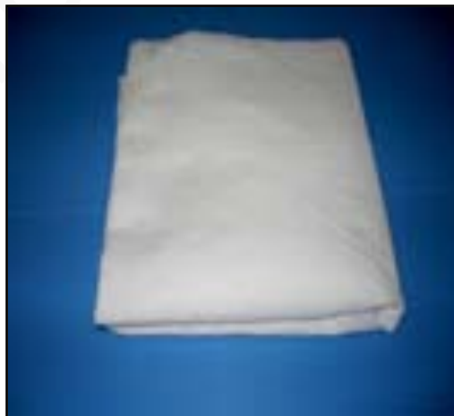
ภาพที่ 1 ผ้ามัดสลิน