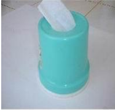
ภาพที่ 5 กระดาษทิชชู ที่ฆ่า (เสาวนีย์ เอกสินเสริม, 2556)

5. กระดาษทิชชู ใช้ในการเช็ดสีและน้ำที่มากเกินไปและอาจใช้รองปากกาเขียน เทียน