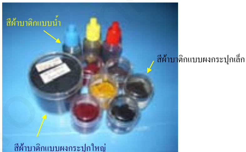
ภาพที่ 2 สีทำผ้าบาติก

1.10 ผ้าไหม ควรใช้ผ้าไหมเนื้อบางเนื่องจากน้ำเทียนไหลซึมผ่านเส้นใยได้ดีกว่าผ้าไหมเนื้อหนาผ้าไหมที่เหมาะสมกับการทำผ้าบาติกมีหลายชนิด เช่น ไหมไทย ไหมจีนผ้า Crepe de Shine Silk สำหรับผ้าไหมควรใช้ไหม 1 เส้นขนาด 2000 (นันทา โรจนอุดมศาสตร์, 2536, หน้า 71)