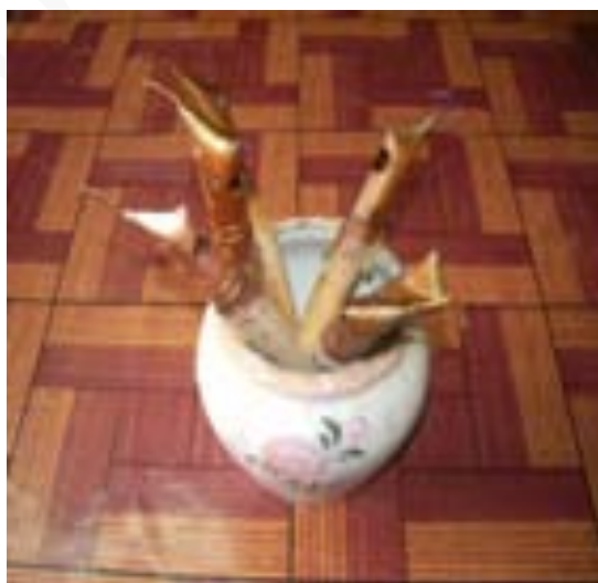
ภาพที่ 8 การเก็บปากกาเขียนเทียน

1.3.3 เส้นขนาดใหญ่ (Large - spouted Canting) เบอร์ L เป็นปากกาที่มีปลายท่อขนาดใหญ่ที่สุดเส้นเทียนที่เขียนมีขนาดใหญ่มากน้ำเทียนจะไหลเร็วเหมาะสำหรับชิ้นงานที่มีพื้นที่กว้างๆ เช่น ผ้าจีน ผ้าพันเอวเป็นต้น