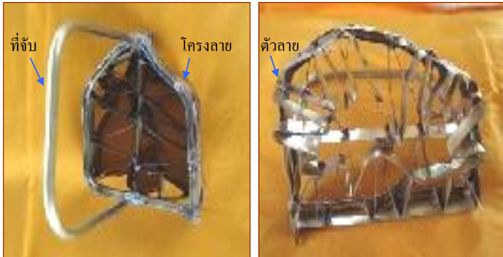
ภาพที่ 9 แม่พิมพ์

การเก็บรักษาปากกาเขียนเทียน ควรเก็บในกล่องหรือกระป๋องโดยวางให้ด้ามลงข้างล่างพวยอยู่ข้างบน พวยจะได้ไม่หักถ้าปากกาเขียนเทียนตันให้ต้มกับน้ำผสมโซดาแอสหรือน้ำสบู่ (นันทา โรจนอุดมศาสตร์, 2536, หน้า 58)