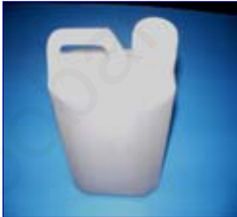
ภาพที่ 4 น้ำยากันสีตก (โซเดียมซิลิเกต)

3.5 น้ำมันพืช ใช้ผสมเทียนทุกชนิดและเทียนที่ใช้กับวาดลายเขียน เป็นการป้องกันไม่ให้เทียนแตกน้ำมันพืชที่นิยมกันมีหลายชนิดเช่น น้ำมันถั่ว น้ำมันมะพร้าว น้ำมันปาล์ม (นันทา โรจนอุดมศาสตร์, 2536, หน้า 72)