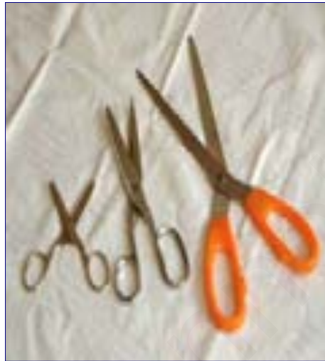
ภาพที่ 15 กรรไกร

9. ภาชนะต้มเทียน ควรเป็นภาชนะที่เก็บความร้อนได้ดีเช่น หม้อสแตนเลส หรือ หม้อเคลือบหม้อที่ใช้ต้มน้ำเทียนควรมีลักษณะปากกว้างก้นลึกสะดวกในการตักน้ำเทียน (วัชรพงศ์ หงษ์สุวรรณ, 2548, หน้า 7)