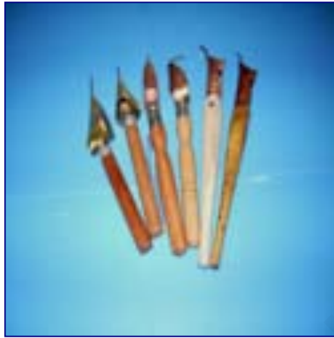
ภาพที่ 6 ปากกาเขียนเทียน ที่มา (เสาวนีย์ เอกสินเสริม, 2556)