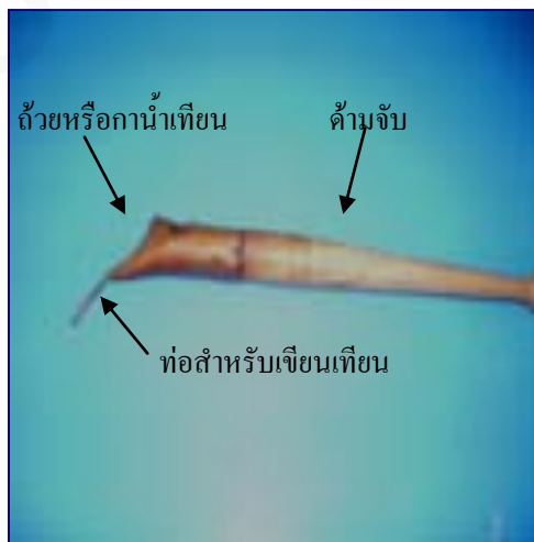
ภาพที่ 7 ส่วนประกอบปากกาเขียนเทียน

เป็นอุปกรณ์สำหรับใช้เขียนเทียนลงบนผ้า เครื่องมือชนิดนี้ใช้กันตั้งแต่สมัยโบราณปากกาเขียนเทียนมีหลายแบบได้แก่รูปแบบยาวรี รูปกลม รูปรองเท้าหรือรูปทรงกระบอก