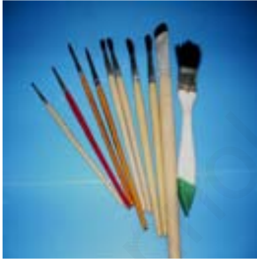
ภาพที่ 12 แปรง พุ่งัน ที่มา (เสาวนีย์ เอกสินเสริม, 2556)

4. กรอบไม้ (Frame) ใช้สำหรับจิ้งหรือยัดผ้าให้ตึงใช้สำหรับผ้าบาติกที่เขียนด้วยมือ กรอบไม้ควรทำจากไม้เนื้ออ่อนมีน้ำหนักเบาสามารถเคลื่อนย้ายได้ง่ายลักษณะของ กรอบไม้ที่ใช้สำหรับจิ้งผ้าในงานผ้าบาติกที่เขียนด้วยมือนี้มีหลายรูปแบบด้วยกันคือ