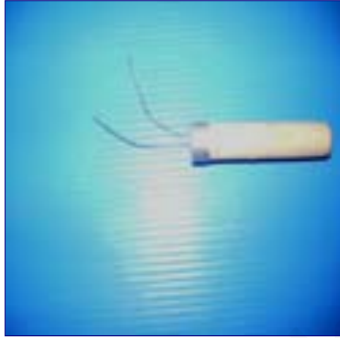
ภาพที่ 10 ไม้แทงปากกาเขียนเทียน

3. ไม้แทงปากกาเขียนเทียน เป็นอุปกรณ์ที่มีด้ามเป็นไม้ส่วนปลายเป็นเส้นลวดขนาดเล็กหรืออาจจะใช้สายกีตาร์เส้นเล็กๆ ใช้ส่วนที่เป็นเส้นลวดแทงที่ปลายท่อของปากกา (นภาพร โคนุชิต, 2548, หน้า 10)