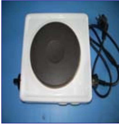
ภาพที่ 13 เตาไฟฟ้า

8. เตาต้มเทียน ควรเป็นเตาไฟฟ้าที่ปรับอุณหภูมิได้ผู้ใช้สามารถควบคุม ความร้อนของน้ำเทียนได้พอดีทำให้การเขียนเส้นเทียนไม่มีปัญหาส่วนเตาแก๊สก็ใช้ได้แต่ควรระวังเพราะน้ำเทียนอาจจะหยดหรือหกทำให้ไฟลุก (นภาพร โคนุชิต, 2548, หน้า 12)