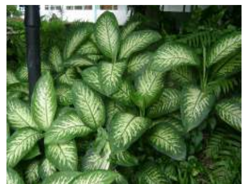
(ฉ) สาวน้อยประแป้ง