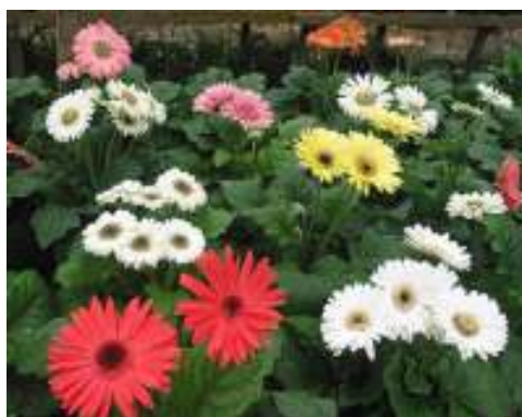
(ข) เยอบีร่า