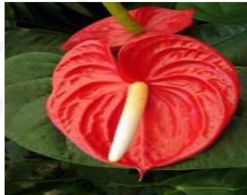
(ข) หน้าวัว