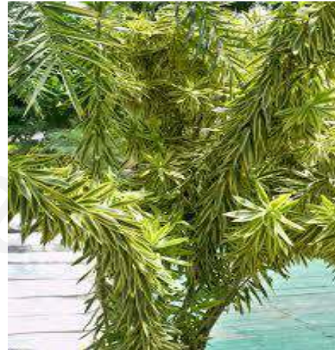
(ง) ชองออฟจาไม้ก้ำ