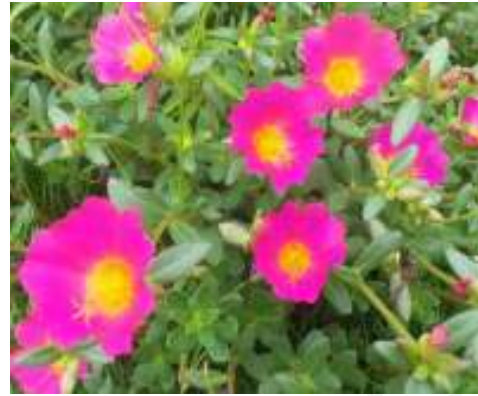
(ข) แพร่เซียงไฉ่