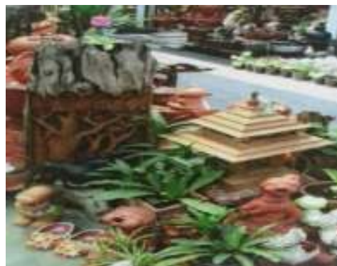
(ก) ธุรกิจที่เกี่ยวข้อง โรงงานกระถาง และอุปกรณ์ในการจัดสวน