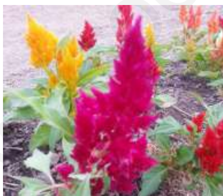
(จ) สร้อยไก่