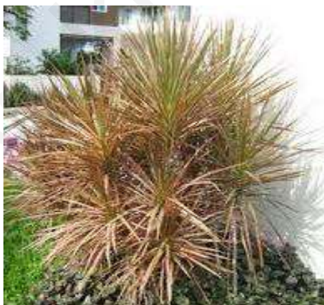
(จ) เข็มสามสี