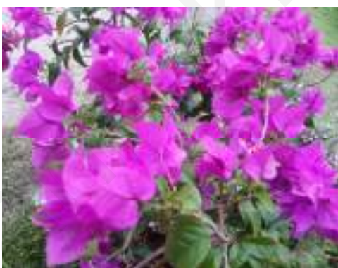
(ง) เฟื่องฟ้า