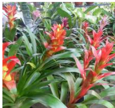
(ฉ) สับประตีสี