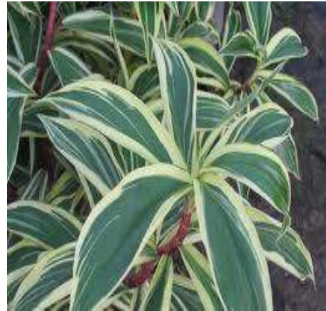
(ข) เอื้องหมายนาต่าง