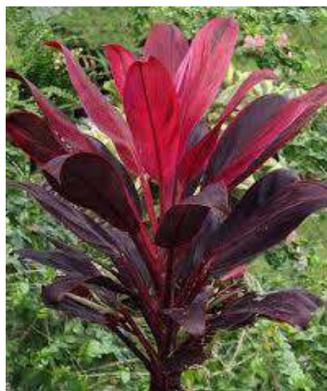
(ก) หมากผู้หมากเมีย