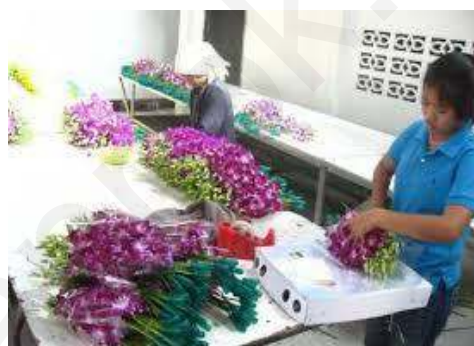
(ข) อาชีพจำหน่ายไม้ดอกไม้ประดับ