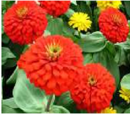
(ก) บานชื่น