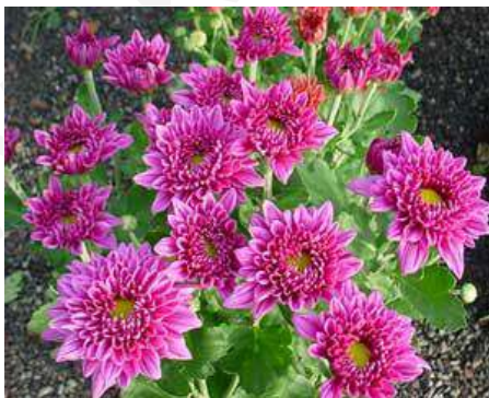
(ค) เบญจมาศ