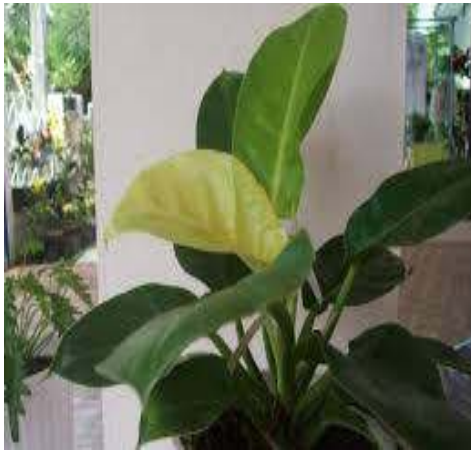
(ก) ฟิโลเดนดรอน