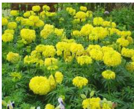
(ก) ดาวเรือง