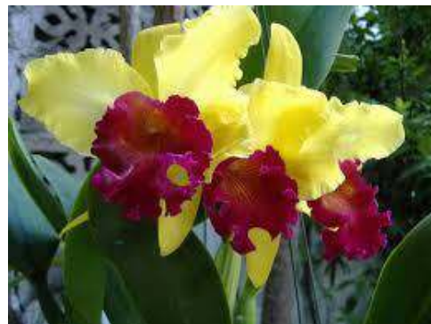
(ง) กล้วยไม้