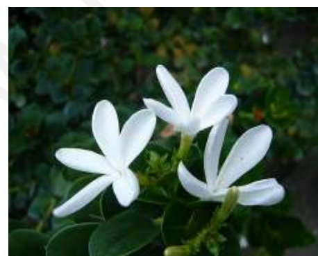
(จ) หีบไม้งาม