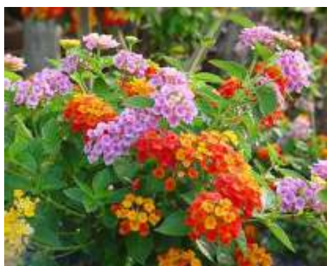
(ค) ผกากรอง