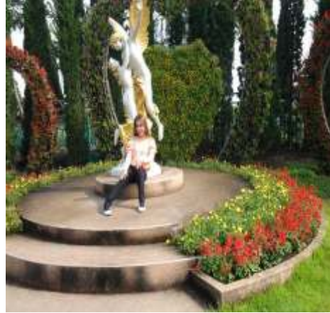
(ก) จัดตกแต่งสถานที่ท่องเที่ยว