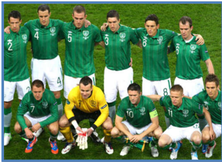
ภาพที่ 6 การแต่งกายของผู้เล่น

1.5 ถุงมือสำหรับผู้รักษาประตู ป้องกันการลื่นในสภาพสนามแฉะและมีโคลน หลังใช้ต้องทำความสะอาดและผึ่งให้แห้งในที่ร่ม