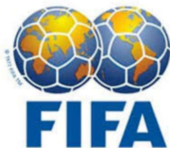
ภาพที่ 3 สัญลักษณ์สหพันธ์ฟุตบอลนานาชาติ

ปี พ.ศ. 2480 2481 -ข้อบังคับปัจจุบันเขียนขึ้นตามระบบใหม่ขององค์การควบคุม โดยใช้ข้อบังคับเก่ามาเป็นแนวทาง