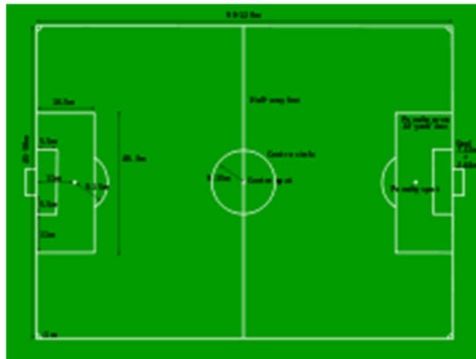
ภาพที่ 7 สนามฟุตบอลและขนาดมาตรฐาน

2.6 ธงมุมสนาม ปักไว้ที่มุมสนาม ใช้แล้วนำมาเก็บให้เรียบร้อย และนำไปปักเมื่อต้องการใช้การบำรุงรักษาสุขภาพ