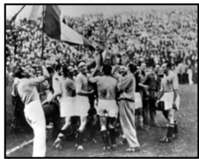
ภาพที่ 1 บรรยากาศการเล่นฟุตบอลในสมัยก่อน