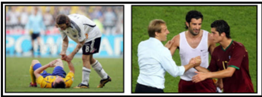
ภาพที่ 5 น้ำใจนักกีฬาเป็นสิ่งที่ทุกคนต้องมี

ที่มา : https://sites.google.com/site/s5310835151/home/ , 2558