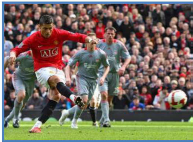
ภาพที่ 4 กีฬาฟุตบอล

7. ปัจจุบันผู้เล่นฟุตบอลที่มีความสามารถสูงยังมีสิทธิ์ได้เข้าศึกษาต่อ ในระดับสูง บางสาขา บางสถาบันได้ และหลายหน่วยงานยังรับบุคคลที่เป็นนักกีฬาฟุตบอลเข้าทำงาน เพราะฟุตบอลกำลังเป็นที่นิยมของวงการทั่วไป และมีการแข่งขันกันอยู่เป็นประจำ