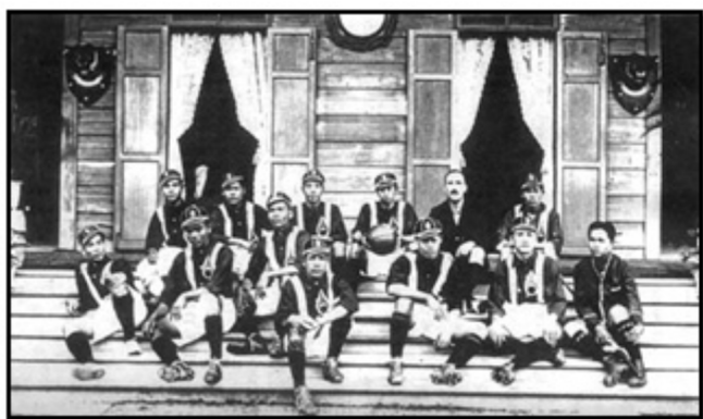
ภาพที่ 2 นักฟุตบอลทีมชาติไทยชุดแรก

การแข่งขันฟุตบอลครั้งแรกอย่างเป็นทางการเมื่อวันเสาร์ที่ 2 กุมภาพันธ์ 2443 ณ สนามหลวงระหว่างชุดบางกอกกับชุดกรมศึกษาธิการ เรียกว่า "แอสโซซิเอชันฟุตบอล" พระบาทสมเด็จพระมงกุฎเกล้าเจ้าอยู่หัวทรงพระกรุณาโปรดเกล้าตั้งสมาคมฟุตบอลแห่งประเทศไทยในพระบรมราชูปถัมภ์ขึ้น มีอักษรย่อ "ส.ฟ.ท." เขียนเป็นภาษาอังกฤษว่า "The Football Association of Thailand under The Patronage of His Majesty The King" ใช้อักษรย่อ F.A.T. เมื่อวันที่ 25 เมษายน 2459 และได้ตั้งทีมฟุตบอลชื่อ "ไอ้ัวป่า" (เสือป่า) เป็นทีมของพระองค์ และเมื่อวันที่ 25 มิถุนายน 2468 พระองค์ได้ทรงสมัครเป็นภาคีสมาพันธ์ฟุตบอลระหว่างชาติ (Federation International Football Association) ใช้อักษรย่อ F.I.F.A. เมื่อ 26 พฤศจิกายน 2499 สมาคมได้สิทธิ์ส่งทีมฟุตบอลไทยเข้าร่วมการแข่งขันกีฬาโอลิมปิก ครั้งที่ 16 ณ นครเมลเบิร์น ประเทศออสเตรเลีย พ.ศ. 2500 ประเทศไทยร่วมเป็นภาคีสมาชิกสมาพันธ์ฟุตบอลแห่งเอเชีย (Asian Football Confederation) มีชื่อย่อว่า A.F.C. จากนั้นสมาคมฟุตบอล ฯ ได้มีโครงการจัดการแข่งขันฟุตบอลภายในประเทศ รวมทั้งเชิญทีมจากต่างประเทศเข้าร่วมแข่งขัน และส่งทีมเข้าร่วมแข่งขันรายการต่าง ๆ ทั้งในและต่างประเทศเป็นประจำ