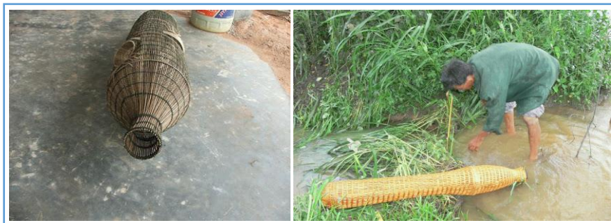
ภาพที่ 15 แสดงไซสำหรับดักปลา