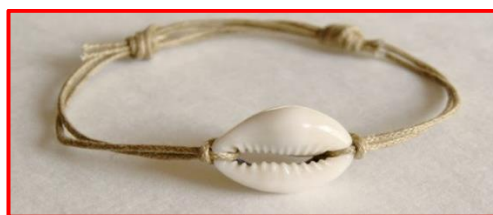
ภาพที่ 16 แสดงสร้อยข้อมือจากเปลือกหอย

5. เครื่องประดับ วัสดุที่นิยมใช้จะเป็นวัสดุดั้งเดิม ตั้งแต่ ดิน เครื่องเงิน เครื่องถม เปลือกหอย ปัจจุบันได้มีการนำเอาวัสดุอื่น ๆ เช่น เปลือกข้าวโพด เกล็ดปลา กะลามะพร้าว ไม้ มาใช้เป็นวัสดุในการประดิษฐ์ด้วยทำให้มีน้ำหนักเบาและราคาถูก