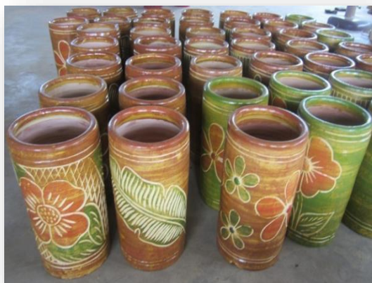
ภาพที่ 18 แสดงแจกันดินเผาจากจังหวัดนครราชสีมา