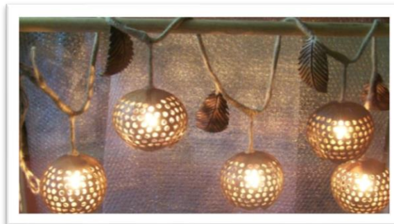
ภาพที่ 4 แสดงโคมไฟจากกะลามะพร้าว