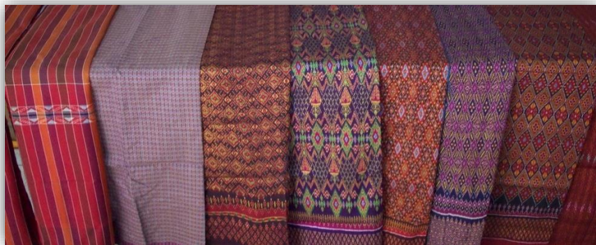
ภาพที่ 12 แสดงผ้าไหมมัดหมี่ บ้านเขว้า

การนำวัสดุในท้องถิ่นมาประดิษฐ์เป็นผลิตภัณฑ์ต่าง ๆ มีจุดมุ่งหมายสำคัญ 4 ประการ ดังนี้ 3. เครื่องนุ่งห่ม ได้แก่ การทอผ้าจากไหมและฝ้าย นำมาตัดเย็บเป็นเสื้อ กางเกง กระโปรง ซึ่งจะมีมากในภาคตะวันออกเฉียงเหนือและภาคเหนือ ลักษณะเด่นของผ้าคือ ลวดลายการทอ เช่น ผ้ามัดหมี่ ผ้าทอลายขิด