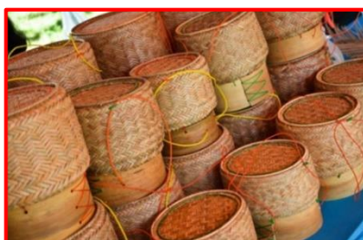
ภาพที่ 10 แสดงกระติบข้าว ภาชนะใส่ข้าวเหนียวของภาคอีสาน

ที่มา: http://yamichada.blogspot.com/2013/09/blog-post_600.html