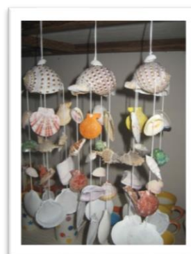
ภาพที่ 5 แสดงโคมบายจากเปลือกหอย