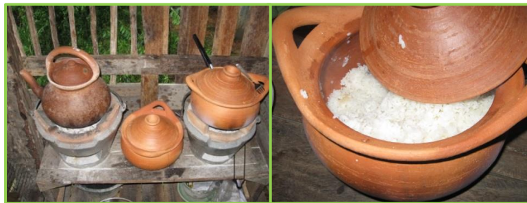
ภาพที่ 6 แสดงเครื่องปั้นดินเผาใช้ประกอบอาหาร

1. เป็นสิ่งของที่ใช้ในชีวิตประจำวัน ได้แก่ การประดิษฐ์ผลิตภัณฑ์เพื่อใช้ในการอำนวยความสะดวกในการใช้ชีวิตประจำวัน เช่น การใช้ดินเหนียวมาปั้นทำเป็นถ้วย ชาม หม้อ ซึ่งถือได้ว่าเป็นสิ่งประดิษฐ์ชนิดแรกๆ ที่มนุษย์สร้างขึ้นเพื่อการดำรงชีวิตที่ดีขึ้น