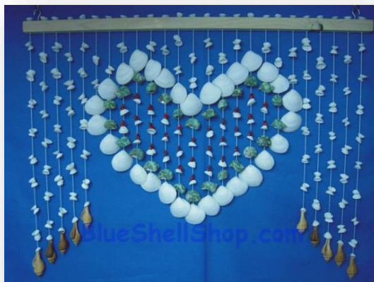
ภาพที่ 17 แสดงเครื่องแขวนจากเปลือกหอย

6. เครื่องตกแต่ง เช่น กรอบรูป เครื่องแขวน แจกันดอกไม้ ตุ๊กตา เครื่องตกแต่งฝาผนัง ซึ่งแต่ละท้องถิ่นก็จะใช้วัสดุที่แตกต่างกันออกไป เช่น เครื่องแขวนจากเปลือกหอยของทางภาคใต้ แจกันดินเผาจากจังหวัดนครราชสีมา