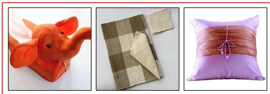
ภาพที่ 13 แสดงผลิตภัณฑ์จากผ้าพื้นเมือง

นอกจากจะนำมาทำเป็นเครื่องนุ่งห่มแล้ว ปัจจุบันยังนำผ้าพื้นเมืองจากหลายๆ ท้องถิ่นไปทำเป็นกระเป๋า ผ้าห่มกล่องกระดาษทิชชู ปลอกหมอน ผ้าปูโต๊ะ และงานฝีมืออื่นๆ เพื่อจำหน่ายอีกด้วย