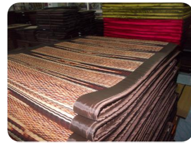
ภาพที่ 11 แสดงการทอเสื่อจากต้นกก ของบ้านแพง อำเภอโกสุมพิสัย จังหวัดมหาสารคาม