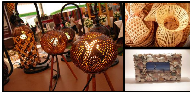
ภาพที่ 1 แสดงงานประดิษฐ์ผลิตภัณฑ์ต่าง ๆ

➡ การประดิษฐ์ผลิตภัณฑ์จากวัสดุท้องถิ่น หมายถึง การนำวัสดุต่าง ๆ ที่มีในแต่ละท้องถิ่น มาสร้างสรรค์ออกแบบเป็นผลิตภัณฑ์ที่ให้ประโยชน์ตรงกับความต้องการ เช่น เพื่อความสวยงาม เพื่อประโยชน์ใช้สอย เป็นของประดับตกแต่งและสามารถมอบเป็นของขวัญที่ระลึกได้