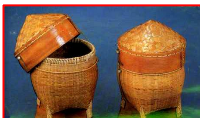
ภาพที่ 9 แสดงก่องข้าว ภาชนะใส่ข้าวเหนียวของภาคเหนือ

2.2 วัฒนธรรม ผลิตภัณฑ์จากวัสดุในท้องถิ่นเป็นการแสดงเอกลักษณ์เฉพาะ ในการดำเนินชีวิตที่มีแบบแผน ขั้นตอน ระบบ ความงาม ทั้งในด้านการประดิษฐ์และด้านสุนทรียภาพ เช่น ภาชนะใส่ข้าวเหนียวของภาคเหนือและภาคอีสาน (ภาคตะวันออกเฉียงเหนือ) ซึ่งเป็นภาชนะใส่ข้าวเหนียวเหมือนกัน แต่รูปแบบลักษณะของผลิตภัณฑ์ต่างกัน มีเอกลักษณ์เฉพาะของแต่ละภาค