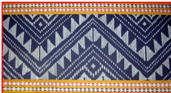
ภาพที่ 7 แสดงผ้าทอลายซิด

คุณลักษณะของผลิตภัณฑ์จากวัสดุท้องถิ่น คือ ความงามอันเกิดจากการสร้างสรรค์ด้วยมือ เป็นสิ่งกลั่นกรองออกมาจากใจ ถ่ายทอดความคิดและรสนิยมของผู้สร้างสรรค์ ออกมาให้เห็นเป็นคุณลักษณะที่ทำให้เกิดความชื่นชมและสุนทรียภาพแก่ผู้พบเห็น เช่น ผ้าทอชนิดต่าง ๆ ที่มีลวดลายการทอที่สวยงาม กระเป๋าย่านลิเกา เป็นต้น