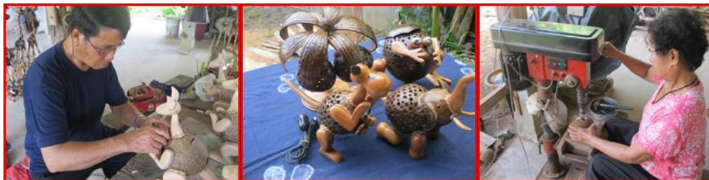
ภาพที่ 8 แสดงการดัดแปลงวัสดุในท้องถิ่นเพื่อเพิ่มรายได้

2.1 เศรษฐกิจ เป็นการนำเอาวัสดุในท้องถิ่นมาดัดแปลง สร้างสรรค์เพื่อใช้สอยในครอบครัวของตนเอง จากนั้นได้ขยายวงกว้างไปยังครอบครัวอื่น จนกลายเป็นระดับท้องถิ่น ระดับภูมิภาคและระดับชาติ เป็นระบบการผลิตเบื้องต้นใช้วัสดุและแรงงานในท้องถิ่นนั้น ๆ เอง ทำให้ครอบครัวมีรายได้เพิ่มขึ้น การผลิตระดับครัวเรือนพัฒนาเป็นการผลิตระดับอุตสาหกรรม จัดเป็นรากฐานทางเศรษฐกิจเบื้องต้น