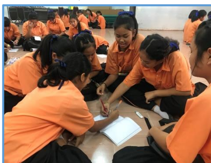
ภาพที่ 2 แสดงการวางแผนการทำงาน