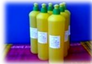
ภาพที่ 1 อุปกรณ์ สารเคมีในการทำน้ำยาล้างจาน ตามท้องตลาด 2