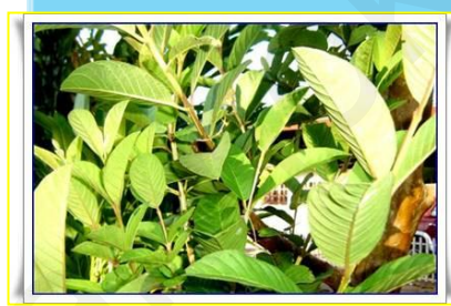
ภาพที่ 2 การทำโครงงานวิทยาศาสตร์น้ำยาล้างจานจากใบฝรั่ง 1