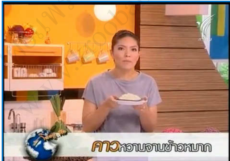
ภาพที่ 1 แสดงตัวอย่างวิดีโอเรื่อง “กินอยู่คือ ข้าวหมาก”

นักเรียนดูวิดีโอเรื่อง “กินอยู่คือ ข้าวหมาก” บนจอโปรเจคเตอร์หน้าชั้นเรียน เก็บรายละเอียดให้ได้มากที่สุด เตรียมอภิปรายร่วมกับเพื่อน ๆ ในชั้นเรียน