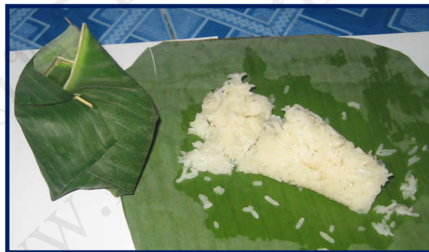
ภาพที่ 2 ตัวอย่าง ข้าวหมากสูตรของครู