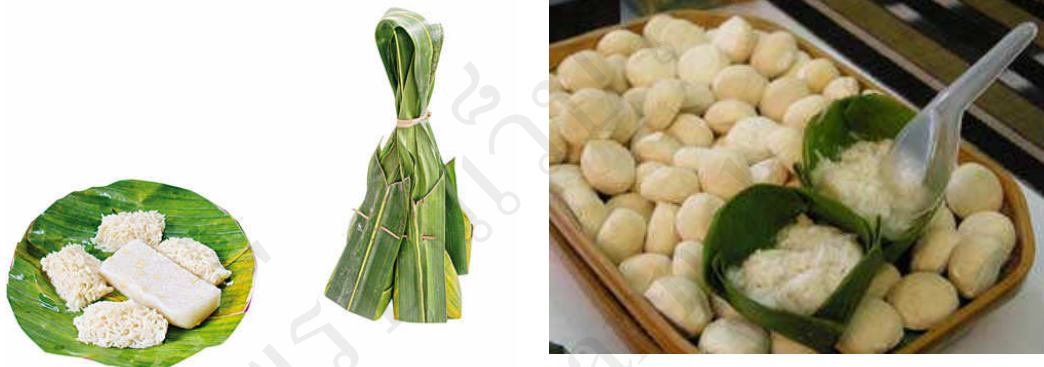
ภาพที่ 3 แสดงข้าวหมาก

ข้าวหมากเป็นอาหารหมักพื้นบ้านของไทย ทำจากข้าวเหนียวทั้งข้าวเหนียวธรรมดา และข้าวเหนียวดำ แต่ข้าวเหนียวดำมักไม่ค่อยพบบ่อยนัก ในการทำข้าวหมากจะต้องใช้ลูกแป้งข้าวหมาก ซึ่งมีลักษณะเป็นก้อนแป้งครึ่งวงกลม สีขาวนวล น้ำหนักเบา ในลูกแป้งข้าวหมากจะมีเชื้อราสกุล Mucor sp., Amylomyces sp. ซึ่งสามารถสร้างเอนไซม์อะไมเลสออกมาย่อยแป้งในข้าวเหนียวให้เป็นน้ำตาล น้ำตาลหรือน้ำหวานที่ได้จากการย่อยข้าวเหนียวนี้เรียกว่า น้ำด้อย มีความหวานประมาณ 30 - 40 องศาบริกซ์ (ปริมาณน้ำตาลคิดเป็นกรัม ของน้ำชูโครสตต่อ 100 มิลลิลิตร) น้ำด้อยที่ข่อยได้ในระยะแรกช่วงวันที่ 1 และ 2 ยังไม่ค่อยหวานจัด เพราะแป้งยังถูกย่อยไม่สมบูรณ์ จะเริ่มหวานจัดประมาณวันที่ 3 และถ้าหมักไว้นาน 1 สัปดาห์จะมีกลิ่นห่ออ่อน ๆ เนื่องจากมียีสต์บางชนิด เช่น ยีสต์ในสกุล Saccharomyces sp., หมักน้ำตาลในข้าวหมากเป็นแอลกอฮอล์ จึงควรเก็บข้าวหมากไว้ในตู้เย็นเมื่อหมักได้ที่แล้ว ปฏิกริยาที่เกิดขึ้นแสดงได้ดังสมการต่อไปนี้